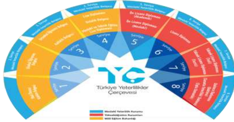
Şekil 3. Türkiye Yeterlilikler Çerçevesi,

tarafından, diğer 3 seviyenin belgelendirilmesi YÖK tarafından gerçekleştirilmektedir. Yeterlilik türlerine göre yapılan sınıflandırmada; 3. Seviye “Kalfalık Belgesi, Ortaokul Öğrenim Belgesi”, 4. Seviye “Ustalık Belgesi, Meslekî Ortaöğretim Diploması”, 5. “Seviye Meslekî Yeterlilik Belgesi ve 5. seviyeye Ön Lisans Diploması” denk gelmektedir.