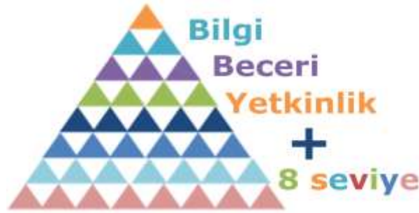
Şekil 2. Yeterlilik Seviyeleri

Türkiye’de eğitim ve iş dünyasında değişkenlik gösteren, birbirinden oldukça farklı olmak üzere çok sayıda yeterlilikler mevcuttur. Yeterlilikleri tek ve standart bir yapı içerisinde, bütünleşik çerçeve oluşturma hedefi Türkiye Yeterlilikler Çerçevesinin çıkış noktasıdır. Türkiye Yeterlilikler Çerçevesi 8 seviyede sınıflandırılmakta ve yeterlilik türleri adı verilen yapılardan oluşmaktadır. Yeterlilik seviyeleri her türlü ortak öğrenme kazanımını ve yeterliliği tanımlamaktadır.