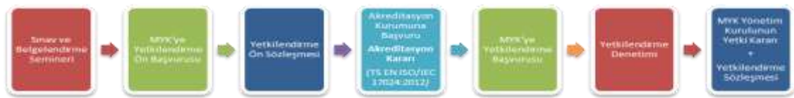
Şekil 4. Kuruluşların Akredite Aşamaları, Kaynak: ( https://portal.myk.gov.tr )

Ön başvurusu sözleşmesini imzalamış yetkilendirme kuruluşları, Mesleki Yeterlilik Belgesi verememektedir. Sadece ilgili yeterliliğe göndermede bulunarak sınav ve belgelendirme yapabilmektedirler. Akredite süreçleri devam eden kuruluşlar bu sayının dışında bulunmaktadır. MYK tarafından Yetkilendirilmiş Belgelendirme Kuruluşları ülke genelinde sınav merkezi oluşturma ve sınav yapma yetkisine sahiptir ( https://www.myk.gov.tr ).