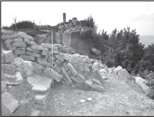
Resim 4: Akropol I. terasta görülen toprak kayması izleri.