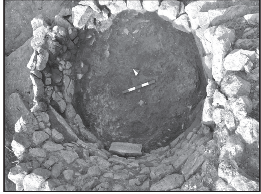
Resim 3: Orta Bizans Dönemine tarihlendirilen seramik fırını kalıntısı.