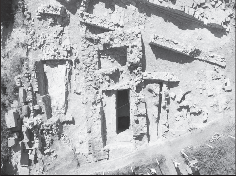
Resim 5: Ceneviz Dönemine tarihlendirilen savunma yapısı.