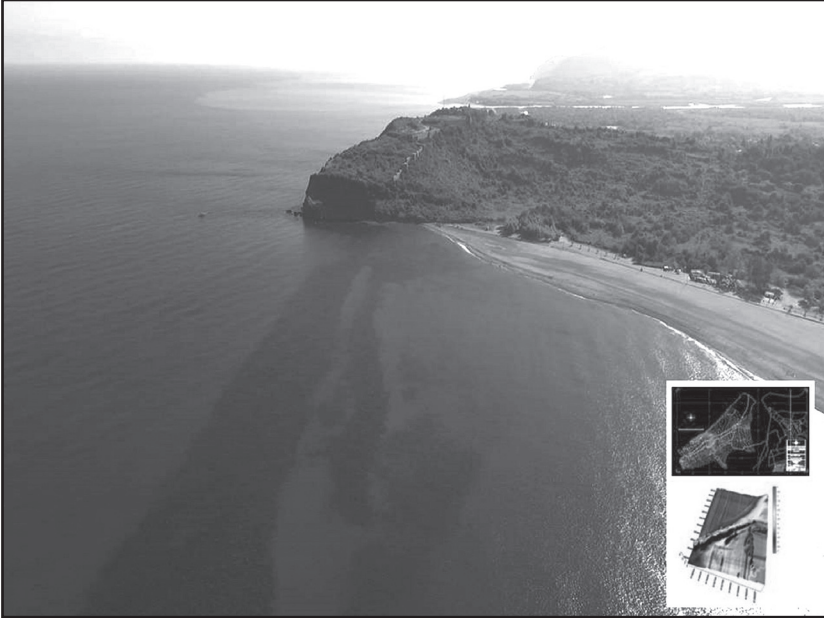
Resim 8: Antik limana ait mendirekler ve batmetrik deniz dibi haritası.