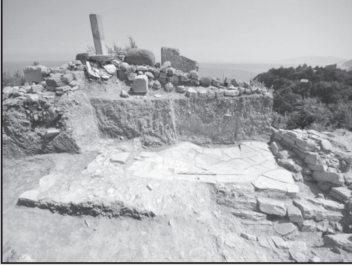
Resim 2: Hellenistik Döneme tarihlendirilen pembe kireçtaşı taban.