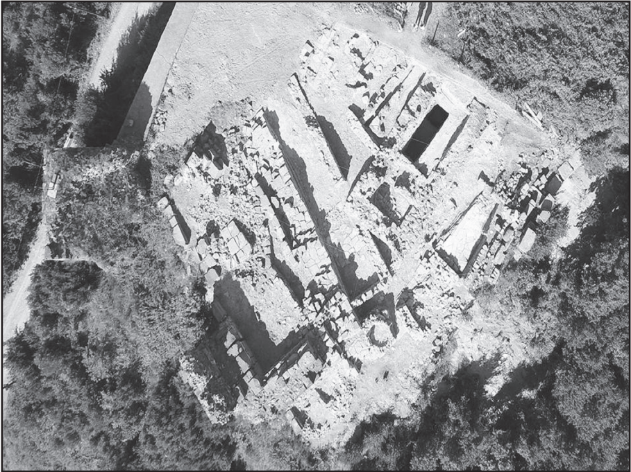
Resim 1: Akropol I. terasda Arkaik Dönem'den Beylikler Dönemine kadar görülen yapı kalıntıları.