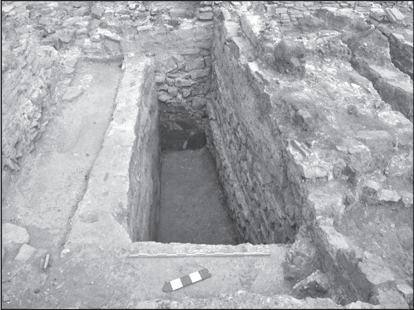
Resim 6: Roma Dönemine tarihlendirilen sarnıç yapısı.