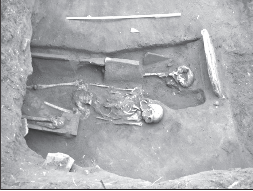
Resim 7: Kentin Doğu nekropolünde ortaya çıkarılan ve Geç Roma Dönemine tarihlen- dirilen basit kiremit mezarlar.