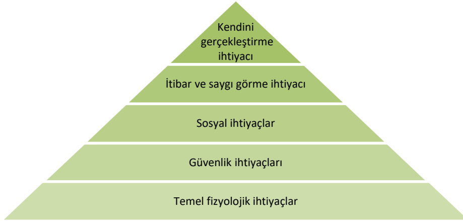
Şekil 2: Maslow'un İhtiyaçlar Hiyerarşisi