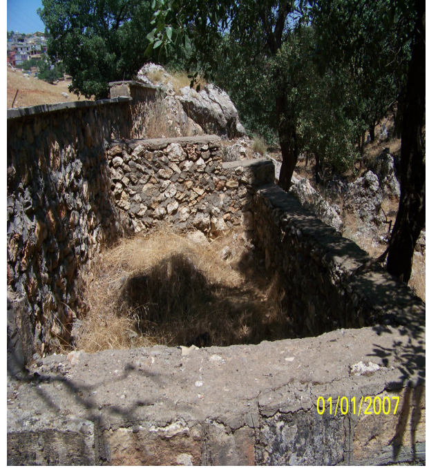
Resim 11: Nisanoğlu Türbesi

3.9.1. Mağara Kilise: Eğil Kalesinin batı bölümünün güneyinde, kalenin içinde yer almaktadır. Kilise içinde