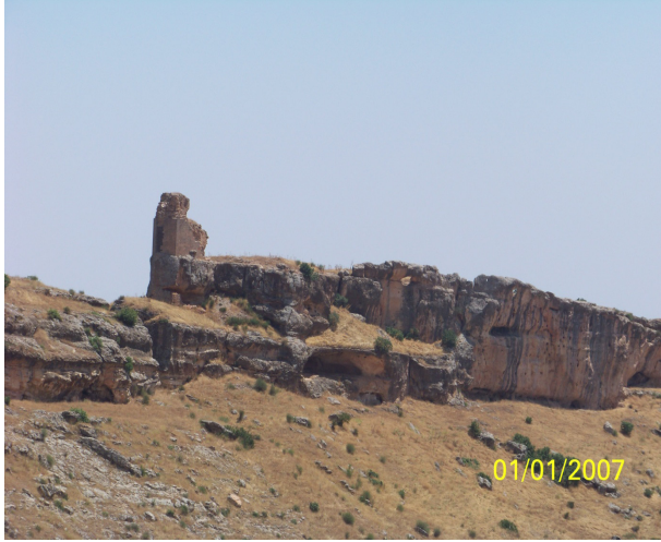
Resim 4: Selman Kalesi

Kaynaklarında “Cebabira” Kalesi olarak geçen kalenin de bu kale olması gerekir. Halk arasında bu kale Cıbeb Kalesi olarak adlandırılmaktadır.