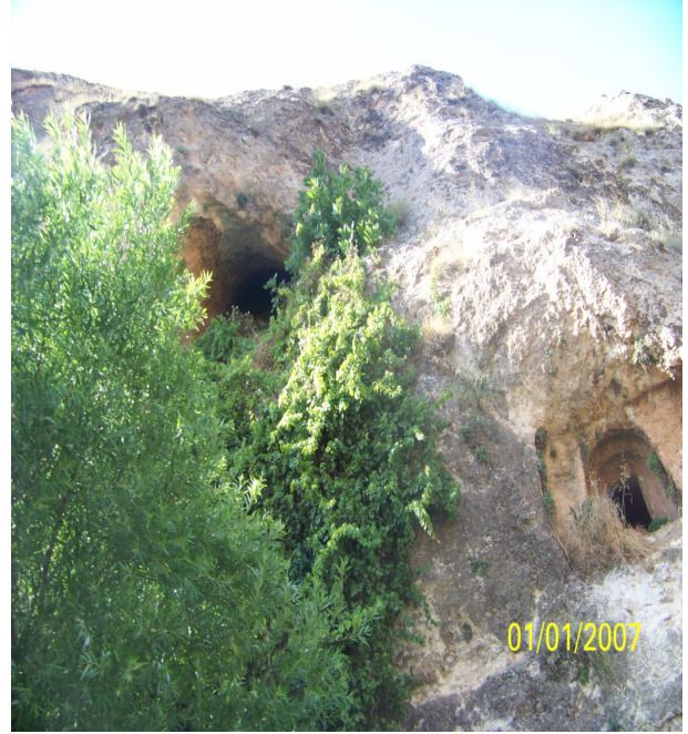
Resim 6: Yapay Mağaralar

dolmasından dolayı kapalı durumdadır. Muhtemelen tünel, sığınak veya yer altı barınma yerlerine gitmektedir. Kaya mezarlarının kuzey iç kısmında çizgi şeklinde bir figür bulunmaktadır (Gündüz ve Cengiz, 2011).