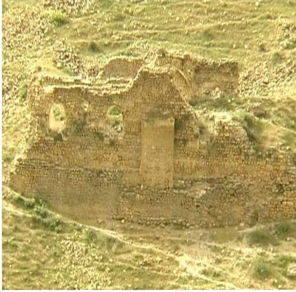
Resim 10: Tacıyan Camisi

mesken(vv) olarak kullanılmakta iken şu anda terk edilmiş haldedir. Onarımı mümkündür (Gündüz ve Cengiz, 2011).