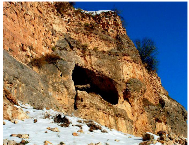
Resim 12: Ermeni -Süryani Kilisesi

3.9.2. Ermeni Süryani Kilisesi: Eğil ilçe merkezinde Kalenin Harem kısmının hemen altında takriben 250-300 M2.lik alan üzerine kurulmuş kubbeli ve sütunlu bir yapıdır. Yapının mihrabı üzerindeki kubbe ses akustiği sağlamak üzere özel yapılmış seramik borularla donatılmıştır. Yapının defineciler tarafından tahrip edilen Süryanice yazılmış kitabesinden yapının M.S.3.yüzyılda yapıldığı anlaşılmaktadır. Kilisenin kale duvarı tarafında yüksekçe bir noktada ağzı duvarla örtülü bir mağaranın içinde Hıristiyanlarca kutsal sayılan