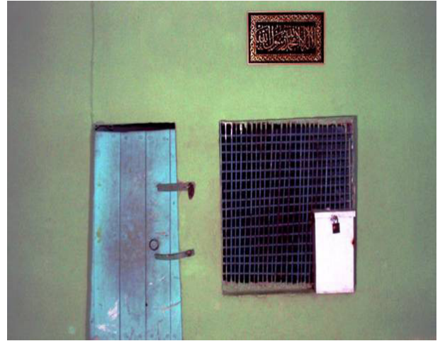
Resim 19: Nebi Harun Türbesi

Yanında bir mezar daha bulunmaktadır. Bu kabir amcasının oğlu Ruyem’e aittir. Türbesi Eğil’in güneydoğusunda bir tepenin üzerindedir. Çevresi meşe ağaçlarıyla kaplıdır. Hz. Elyesa ve Hz. Zülkifl’in kabirleri de yanındaki tepeye nakledilmiştir. Eğil’e ulaşmadan, sağa dönülen bir yolla buraya gidilir (Gündüz ve Cengiz, 2011).