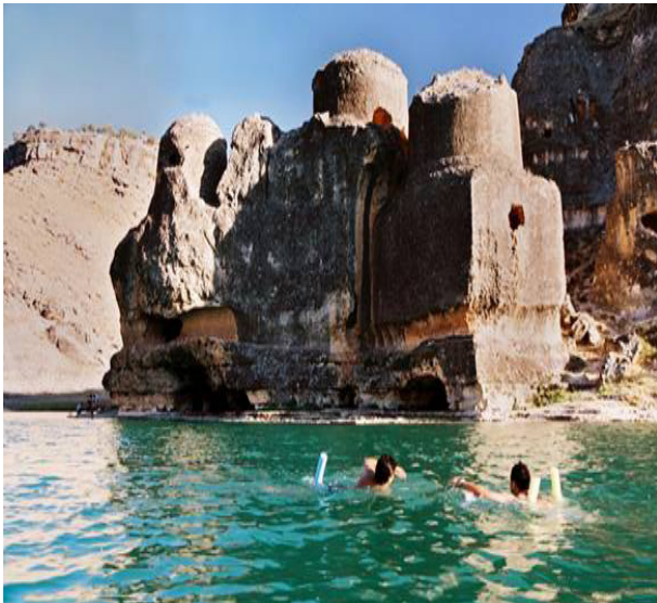
Resim 5: Asur Kral Kaya Mezarları

3.4.5. Asur Kral Kaya Mezarları: Eğil'in en güzide tarihi eserleri arasında olan Asur Kral Kaya Mezarları, II. Şapur tarafından yağmalanmasına rağmen, zamana karşı koyarak asırlardan beri dimdik durmaktadır. Asur hükümdar mezarları ve çevresindeki mağaralar silsilesi kalenin kuzeydoğusunda, Dicle Barajı'nın kıyısında bulunmaktadır. Kayalar oyularak Mısır Ehamları şeklinde inşa edilmiştir. Asur hükümdar kaya mezarlarının doğu tabanında bir tünel bulunmaktadır. Tünelin kısmen