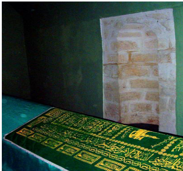
Resim 18: Hz. Zülkifl Kabri

3.14.3. Nebi Harun (Harun-i Asefi): Kabrinin tanıtım yazısında şu ifadeler yer almaktadır: “Bu kabir Berhiya’nın oğlu Harun-i Asefi’nindir. Kendisi Hz. Süleyman’ın kâtibidir.”