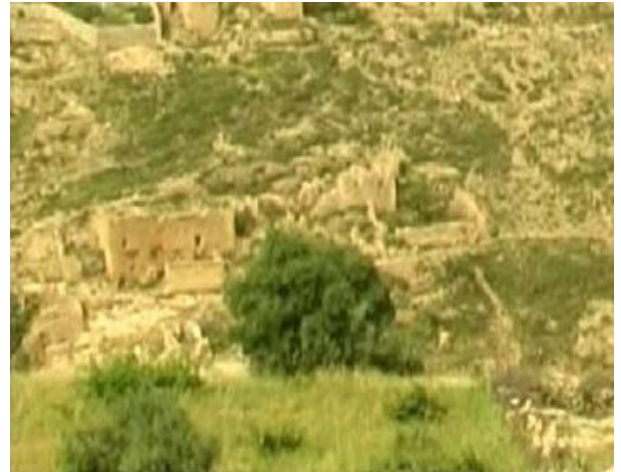
Resim 9: Kale Hamamı