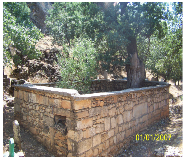
Resim 20: Nebi Alak Kabri

Diyarbakır salnamelerinde Nebi Harun-i Asafi, peygamber olarak ifade edilmekte ve mezarının da Eğil’de olduğu bilinmektedir. Kimliği ve peygamber olup olmadığı hakkında kaynaklarda her hangi bir bilgi tespit edilmemekle birlikte Nebi Harun-i Asafinin peygamber olduğuna inanılmaktadır. Ayrıca Eğil’de bulunan bu mezarın Hz. Musa’nın yardımcısı olarak İsrailoğullarına gönderilen bir peygamberdir. Vefat ettiğinde 123 yaşında olduğu Kitab-ı Mukaddes’te zikredilmektedir. Vefat ettiği zaman Hz. Musa tarafından Hor dağının tepesine defnedilmiştir. Hz. Harun’un defnedildiği Hor dağının nerede olduğu kesin olarak bilinmemektedir. Fakat Hz. Harunun vefat ettiği dönemde İsrailoğullarının Arz-ı Mevuda girmeleri yasaklanmış olduğu için Hor dağının Arz-ı Mevud dışında olması gerekir. Hor kelimesinin Tevrat’ta Diyarbakır’ı da içine alan bölgenin ilk medeni