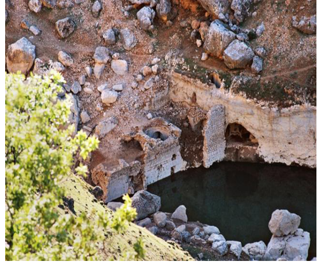
Resim 8: Deran Hamamı

Sıcaklığın dört eyvanlı bir plana sahip olduğu ana hatları ile seçilebilmektedir. Köşelerde küçük halvet hücreleri ile klasik düzeni tekrar eden plan şemasında dikkat çeken husus, batıdaki eyvanda görülen çıkıntıdır. Hangi amaçla yapıldığı tahmin edemediğimiz bu çıkıntının izleri halen görülebilmektedir. Doğu -batı yönlü kırık kemerli bir tonozla örtülü olan külhan hamamın nispeten sağlam kalabilmiş tek kesimidir. Kuzey ve Güney duvarlarında açılan gediklere rağmen tonozu ayakta kalabilmiştir. Yapı çok harap durumdadır. Verdiğimiz plan bir anlamda kroki, bir anlamda da kuramsal bir plandır. Özellikle sıcaklık ve ılıklığın düzeni kesin olarak saptanamamaktadır. Bu hamam da "haçvari tonozlu ve köşe hücreli "tipe dâhil hamamlardandır. Boyutları mütevazı ölçülerde olmakla birlikte, mekânları dağılımı dengelidir. Bu hamam da Dicle Baraj Gölü suları altında kalmıştır (Gündüz ve Cengiz, 2011).