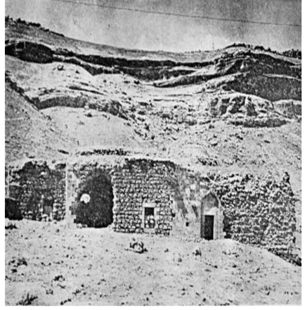
Resim 14: Tekke Medrese

Yapının dış duvarları düzgün sıralar teşkil eden kırma taşlarla örülmüştür. Köşeler, pencere çerçeveleri, taç kapı ve çevresi, bej renkli düzgün taşlarla kaplanmıştır. Doğu cephesinde büyük bir gedik açılmış, taç kapının kuzeyinde kalan duvarın kaplaması sökülüştür.