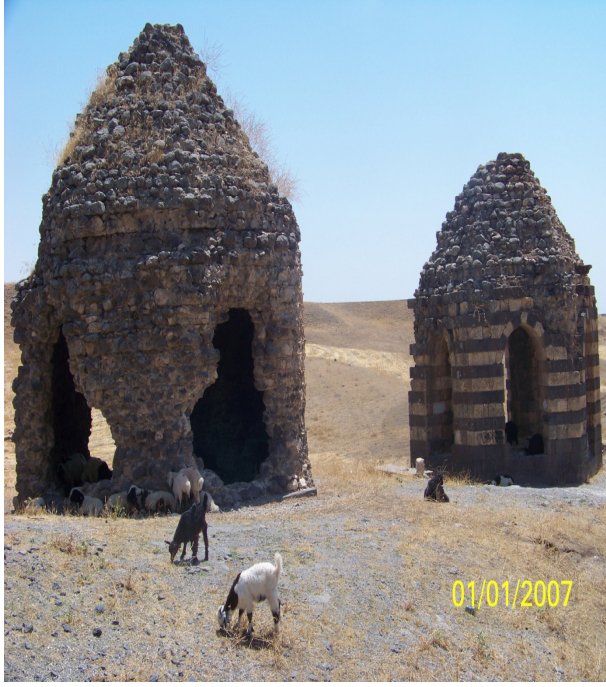
Resim 15: Kasım Bey Kümbeti

ve iç duvarların kaplamaları henüz sağlamdır. Altıgen gövdenin yerden 0,75 m yüksekliğe kadar olan kısmı koyu gri renkli bazalt taşları ile üst kısmı da bazalt ve bej renkli kesme taşlarla almalı duvar düzeninde inşa edilmiştir. Ehlamı külah ile gövdenin birleştiği hizada saçaktan arta kalan oyuk silmenin izleri görülmektedir.