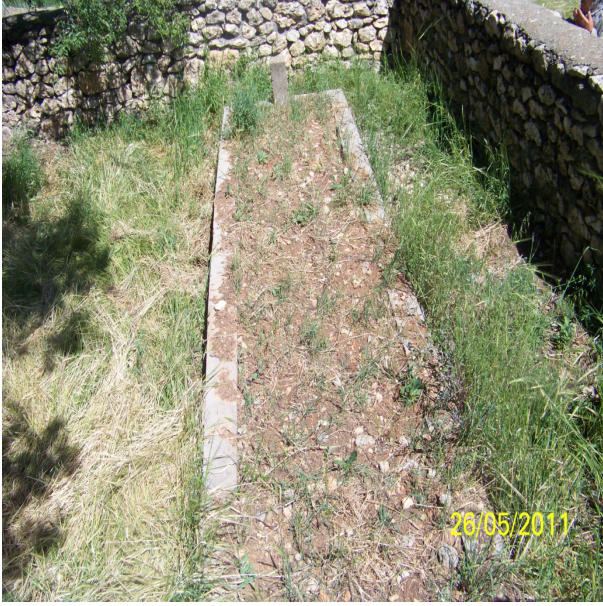
Resim 21: Nebi Zennun Kabri

ahalisi olan Hurriler için kullanıldığı dikkate alınacak olursa Eğil’de bulunan bu mezarın Hz. Musa’nın veziri Hz. Harun’a ait olabileceği düşünülmektedir (Tanıtım Yazısından alınmıştır).