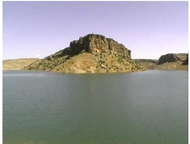
Resim 3: Amini Kalesi