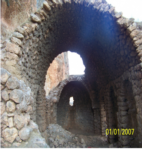
Resim 13: Şahveliyan Kilisesi

beş azizin mezarı vardır. Urfa kralı Abgar tarafından öldürülen Diyarbakır'ın III.Epikürsü Aday'ın da burada gömülü beş azizden biri olduğu tahmin edilmektedir. Bu mezarlardan ikisi ne yazık ki defineciler tarafından 2007 yılında açılıp tahrip edilmiştir. Kilise binası 1962 yılında yıktırılıp taşları Eğil Gündoğuran(Çapan) mahallesindeki cami binasının yenilenmesinde kullanılmıştır (Gündüz ve Cengiz, 2011).