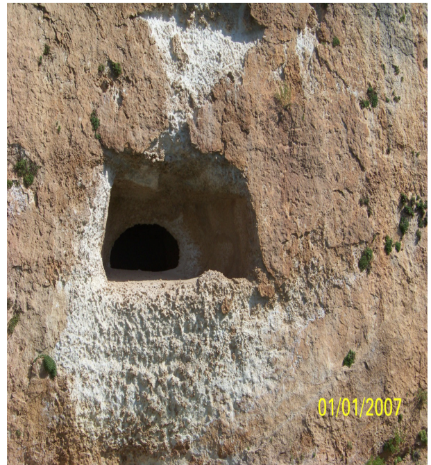
Resim 7: Kaya Mezarları

3.4.6. Kayalardan Yapay Mağaralar: Oyma (yapay) mağaraların çoğu, baraj gölü altında kalan “Deran” denilen bölgede bulunur. Su seviyesinden kurtulan mağaralar görülebilir. Deran Bölgesindeki mağaralar; kayalara cadde açılarak, caddenin sağ ve soluna yüzlerce mağara kazılarak bir şaheser meydana getirmişler.