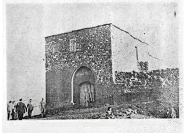
Resim 16: Şerbetin Han

Kümbetin herhangi bir yerinde taşçı markası, süsleme ve kitabe izine rastlanmamaktadır. Mevcut kitabe ve süslemeler, muhtemelen sökülüş kesme taşlarla birlikte yok olmuştur. Kümbeti Miladi XVI. yüzyılın sonuna tarihlenmek mümkündür (Gündüz ve Cengiz, 2011).