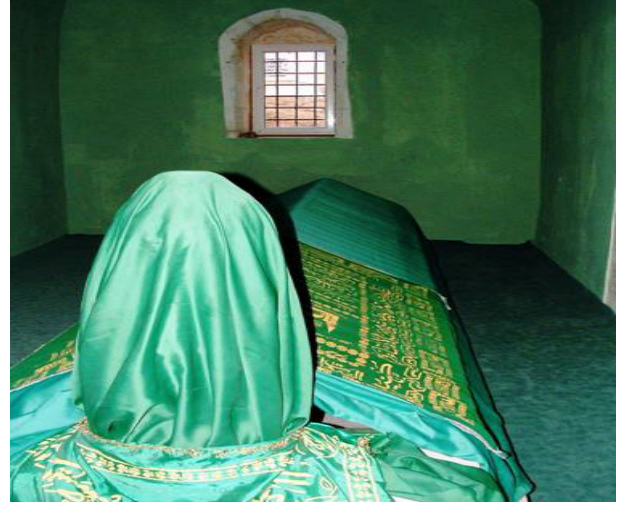
Resim 17: Hz. Elyesa Kabri

3.13.4. Theodoto: Eğil'de doğup bu bölgede Hıristiyanlık adına faaliyette bulunan kişilerden biridir.