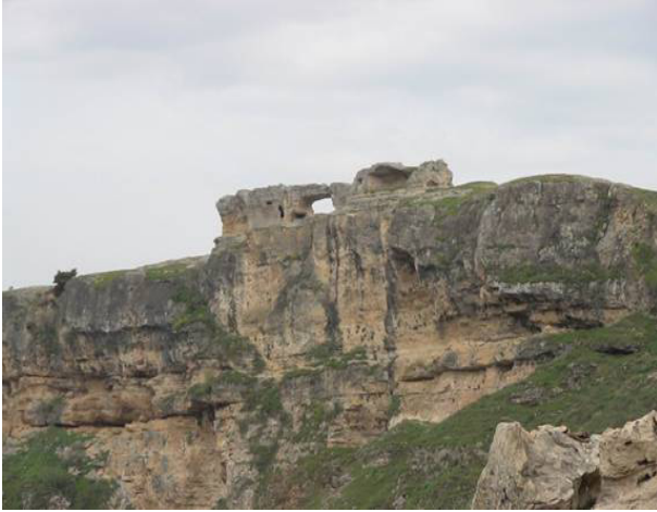
Resim 1: Asur Kalesi

derin vadilerle çevrili, öteki tarafı da oyularak, stratejisi önemli bir yapıya kavuşturulmuştur. Kalenin etrafı bugün dahi varlığını koruyan surlarla çevrilmiştir. O günün silahları göz önüne alındığında kolay fethedilebilecek bir türden olmadığı anlaşılmaktadır. Kalenin büyüklüğü 3 futbol sahasından da büyük olup, iç kısmı kısmen boş olup zamanında depo ve sığınak olarak kullanılmıştır. Eğilli Yuhanna'nın "Kilise Tarihi" adlı eserinin II. Cildinde; Hunlar ile Doğu Roma (Bizans) arasında geçen savaşlarda gerek halkın, gerekse de askerlerin Eğil Kalesi'ne sığınmış olduklarını ifade edilmektedir.