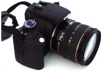
Şekil 1. Görüntülerin çekiminde kullanılan fotoğraf makinesi

Orman Fakültesi binasının ve yerleşke girişinin fotoğrafları Canon marka dijital fotoğraf makinesi (5MP) ile çekilmiştir (Şekil 1). Elde edilen dijital görüntüler Adobe PhotoShop programında düzenlenerek istenen dijital resimler oluşturulmuştur.