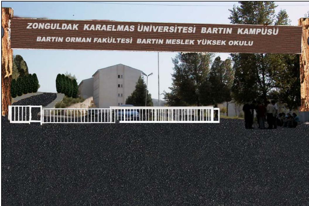
Şekil 14. Orman Fakültesi girişinin şu anki görünümü ve düzenlenmiş hali.