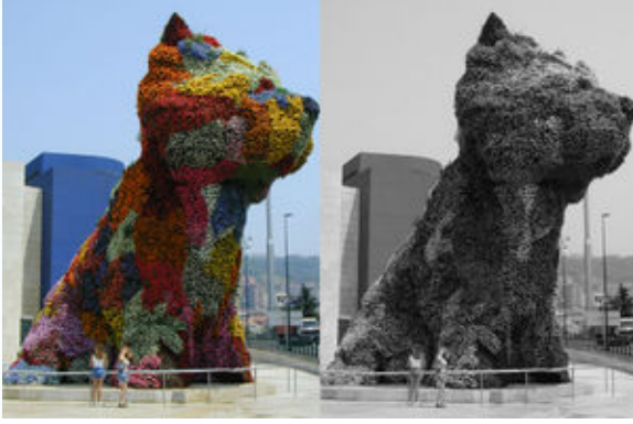
Şekil 9. Renk değişikliği

Grafik editörleri ile görüntü renginde değişiklikler yapmak mümkündür. Renk paleti 2, 16, 256 ve 16.000.000 renk seçeneği şeklinde sunulabilir. JPEG ve PNG görüntü formatları 16.7 milyon renk seçeneğine sahiptir. Bununla birlikte gri tonlama görüntünün daha az yer kaplamasını sağlar (Şekil 9).