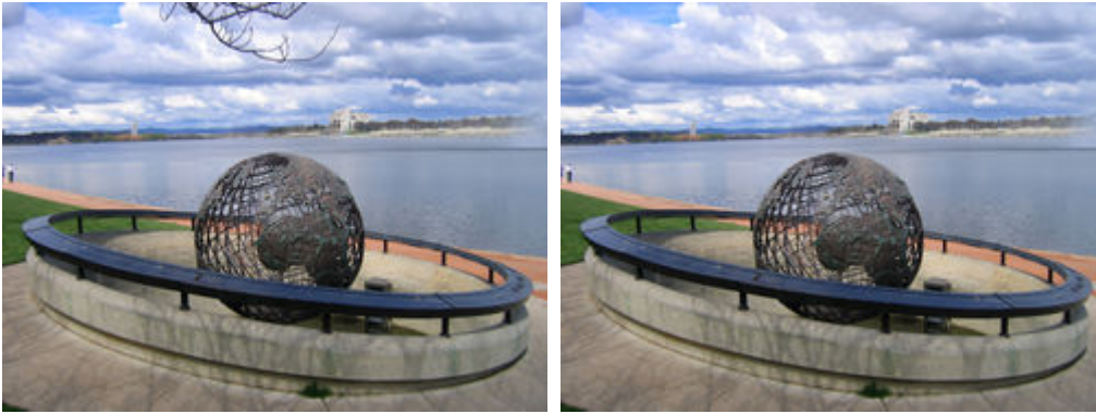
Şekil 3. İstenmeyen kısmın atılması

Birçok editör orijinal görüntü üzerinde istenmeyen kısımların atılmasını kolayca yapabilmektedir. Clone adı verilen bu özellik sayesinde çizim istenmeyen element üzerine odaklanır. O kısmın atılması sonucu onun bıraktığı boşluk o zemin üzerinde dolgu renklerine yakın piksellerin renkleri ile doldurulur. Böylece sanki istenmeyen parça resim üzerinden silinmiş gibi görülür. Şekil 3'te de görüldüğü üzere ilk bakışta görüntü üzerindeki dal dikkati çekmektedir. Ancak istenmeyen bu kısmın çıkarılmasıyla tüm dikkatleri asıl görüntüde istenen kısma yani dünyaya çevrilecektir.