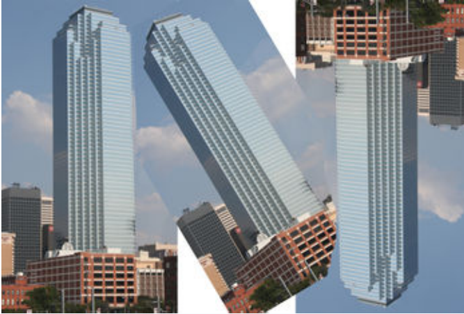
Şekil 6. Görüntünün çevrilmesi

Görüntü editörleri görüntüyü istenen yönlerde çevirebileceği gibi istenen açılarda da görüntüleri çevirebilmektedir (Şekil 6). Aynı zamanda görüntülerin aynadaki yansımalarını da kullanıcıya sunmaktadırlar.