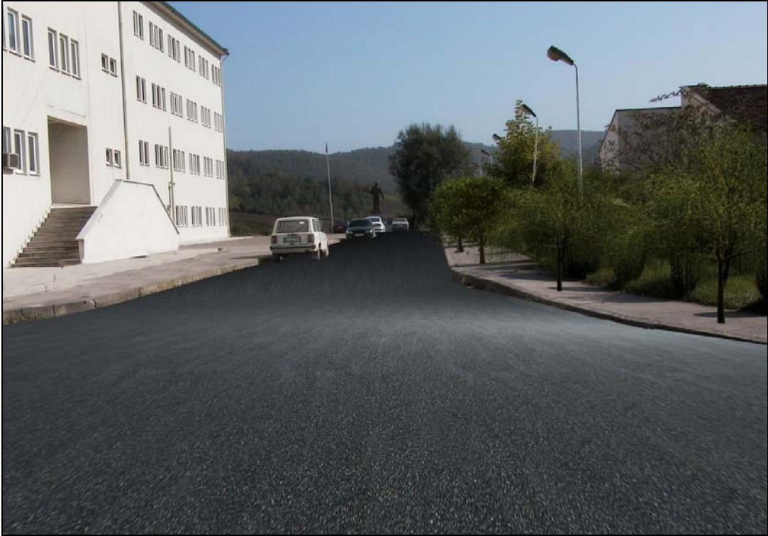
Şekil 11. Orman Fakültesi binasının şu anki görünümü ve düzenlenmiş hali.