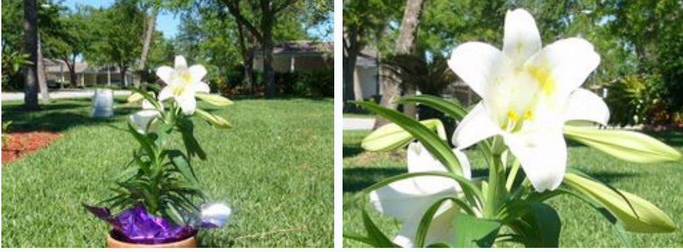
Şekil 2. Kırılmamış ve kırılmış görüntü

Dijital editörler görüntüleri kırpma yeteneğine de sahiptirler. Kırpma sonucunda arzu edilen dikdörtgen içerisinde kalan görüntü kırılarak yeni görüntü oluşturulur. İstenmeyen kısımlar ise (bu dikdörtgenin dışında kalanlar) atılır (Şekil 2). Dijital kırpma işlemi kesilen alanın çözünürlüğü üzerine herhangi bir etkide bulunmaz. Kırpma işleminde verimli bir işlem yapabilmek için eldeki görüntünün yüksek çözünürlükte olması gerekmektedir.