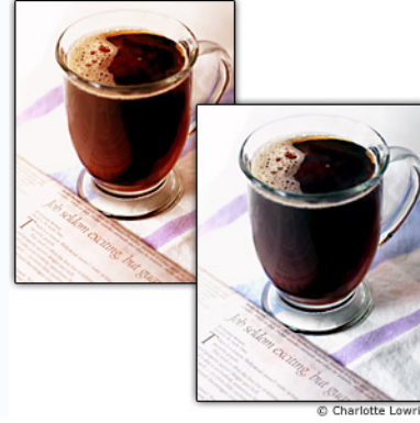
Şekil 10. Görüntüde kontrast ve parlaklık