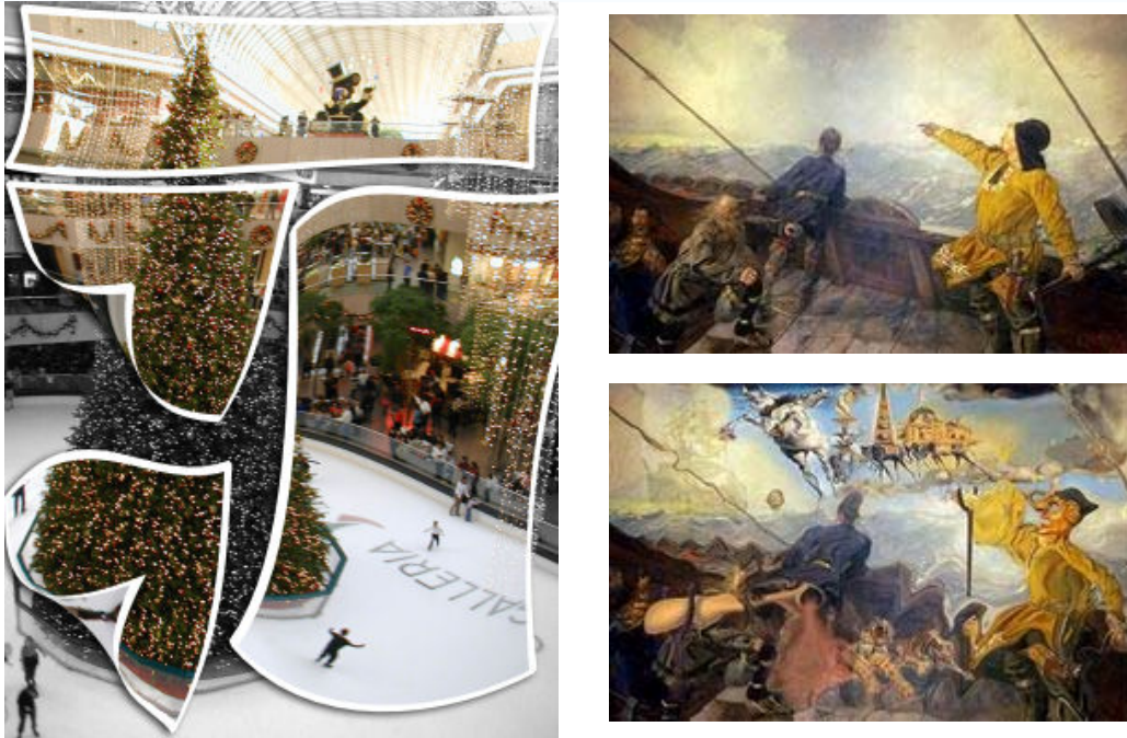
Şekil 8. Çeşitli efektlerin olduğu görüntüler

Görüntü editörleri genellikle içinde farklı efektlerin bulunduğu bir listeyi kullanıcısına sunarlar. Burada görüntüler üzerinde çeşitli düzenlemeler otomatik olarak yapılır. Bunlar arasında görüntü renkleri üzerinde sunulan efektler, görüntüyü eğme, germe efektleri, artistik efektler, geometrik ve yazı efektleri ve bunların kombinasyonları şeklinde sıralanabilir. Şekil 8’de bazı örnekler verilmiştir.