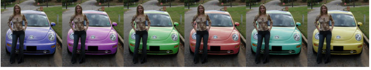
Şekil 4. Renk seçimi