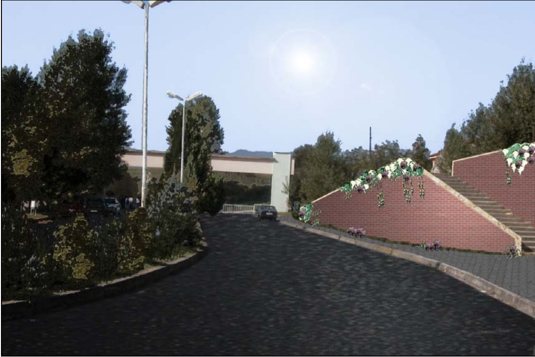
Şekil 13. Orman Fakültesi girişinin şu anki görünümü ve düzenlenmiş hali.