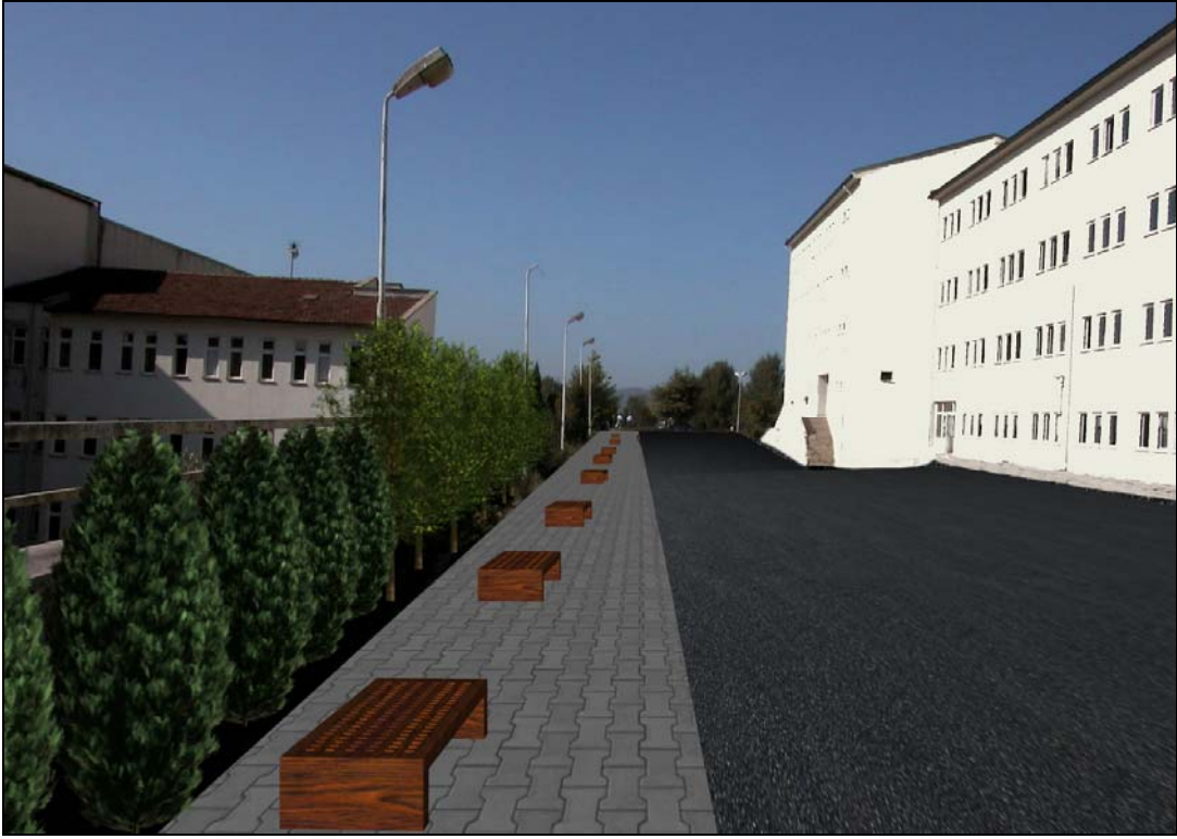
Şekil 12. Orman Fakültesi binasının şu anki görünümü ve düzenlenmiş hali.