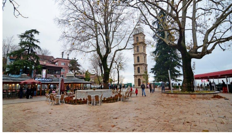
Şekil 3. Tophane Meydanı genel görünüşü