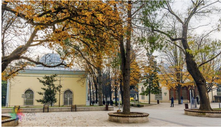
Şekil 4. Tophane Meydanı Orhangazi ve Osmangazi türbeleri

Bu alan aynı zamanda insanlar için buluşma noktası niteliğindedir. Ancak mevcut durumda çevre düzenlemesi, bitkisel öğeler, yapısal donatılar, bakım gibi sorunları bulunmaktadır. Kent halkı ve ziyaretçiler için kentin odak noktası durumundaki bu alanın yenilenmesi gerekmektedir.