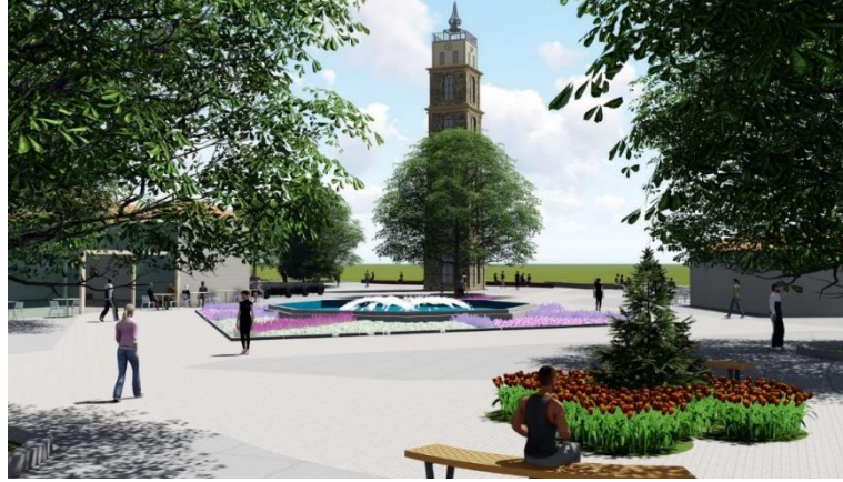
Şekil 12. Tophane Meydanı oturma alanları görünüşü

Tophane Meydanı turistik gezi dışında Bursa halkı için buluşma ve seyir noktası niteliğindedir. Meydana gelen misafirler için yeme içme mekanları bulunmaktadır. Önerilen tasarımla yeme içme mekanlarının daha tanımlı olması, derme çatma veya kimliksiz yapılar yerine alanın ve kentin kimliğine uygun form ve malzeme ile yapılması düşünülmüştür.