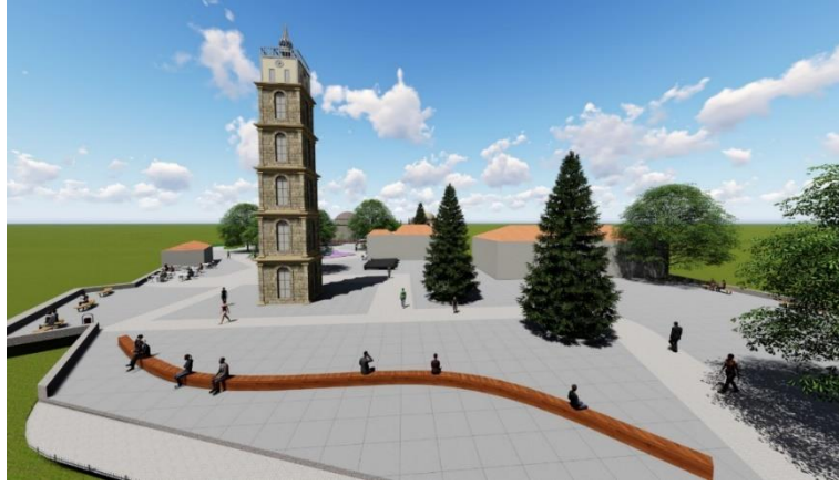
Şekil 9. Tophane Meydanı tarihi saat kulesi ve Osmanlı topları

Türbe ve yakın çevresinde şadırvan bulunmaması nedeniyle türbe yanına şadırvan düşünülmüştür. Ziyaret için gelen misafirlerin abdest alıp, ibadet edip, dinlenebileceği mekanlar tasarlanmıştır. Alan topografya olarak yukarıda bulunduğu için özellikle yazın direk güneş ışınlarına maruz kalmaktadır. Alanı gün içinde ziyaret edenlerin rahat kullanmaları için ağaç altı banklar ile pergola ve kameriye gibi gölgeli oturma birimleri düşünülmüştür.