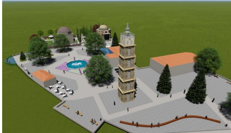
Şekil 10. Tophane Meydanı saat kulesi yönünden görünüş

Türbe ve yakın çevresinde şadırvan bulunmaması nedeniyle türbe yanına şadırvan düşünülmüştür. Ziyaret için gelen misafirlerin abdest alıp, ibadet edip, dinlenebileceği mekanlar tasarlanmıştır. Alan topografya olarak yukarıda bulunduğu için özellikle yazın direk güneş ışınlarına maruz kalmaktadır. Alanı gün içinde ziyaret edenlerin rahat kullanmaları için ağaç altı banklar ile pergola ve kameriye gibi gölgeli oturma birimleri düşünülmüştür.