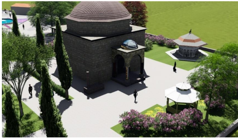
Şekil 7. Tophane Meydanı Orhangazi türbesi

Tophane Meydanı projesi yapılırken mevcut bitki varlığı ve alanın tarihi yapısı göz önünde bulundurularak tasarım yapılmıştır. Tarihi dokuya zarar vermeden iyileştirmeler yapılmış ve alanda görülen eksiklikler tamamlanmıştır. Öncelikle tarihi yapılara bakım ve onarım önerileri getirilmiştir. Türbe ziyaretine gelen misafirler kent içinden olabildiği gibi farklı şehir ve ülkelerden de olabilmektedir. İnsanların alanda daha fazla vakit geçirebilmeleri ve dinlenebilmeleri için türbe yakınında açık oturma alanları ve kameriyeler düşünülmüştür.