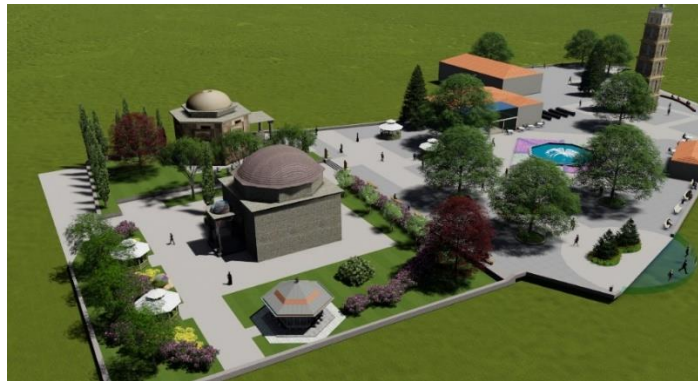
Şekil 5. Tophane Meydanı projesi genel görünüşü

Proje tarihi çevre koruma ve düzenleme ve meydan tasarım ilkeleri doğrultusunda şekillenmiştir. Bu kapsamda tarihi yapıların restorasyonu, çevrelerindeki yapısal ve bitkisel düzensiz öğelerin kaldırılması ve dolayısıyla görünürlüklerinin artırılmasıyla başlamıştır.