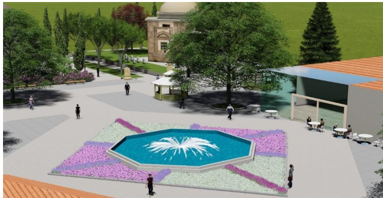
Şekil 11. Tophane Meydanı havuz ve yeme içme alanından görünüş

Tophane Meydanı'nı çekici hale getiren unsurlar arasında tarihi saat kulesi ve Osmanlı topları yer almaktadır. Bu alan aynı zamanda seyir noktası niteliğindedir. Kenti izlemek isteyenler bu alana ilgi göstermektedirler. Bu noktalarda fotoğraf çekilmek isteyen insanlar için cep şeklinde genişlemeler