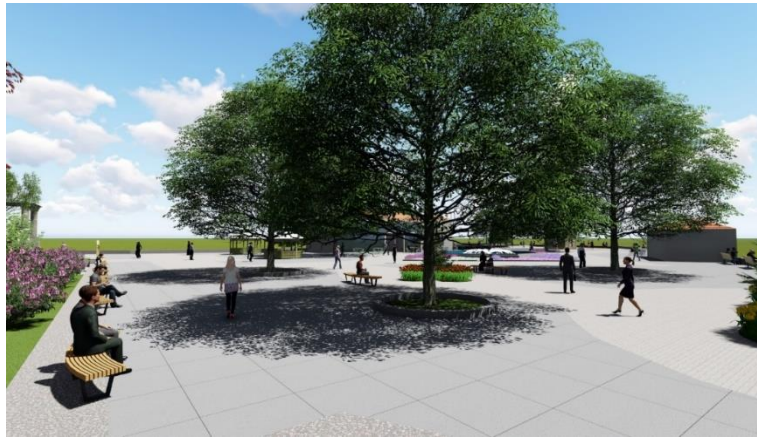
Şekil 14. Tophane Meydanı bitkisel düzenlemelerden görünüş