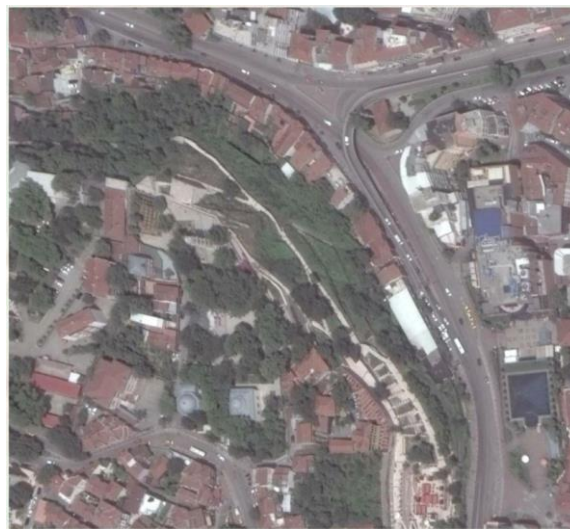
Şekil 2. Tophane Meydanı Google earth görüntüsü