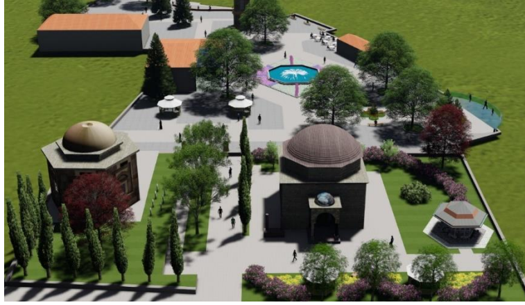
Şekil 6. Tophane Meydanı projesi türbeler yönünden genel görünüş