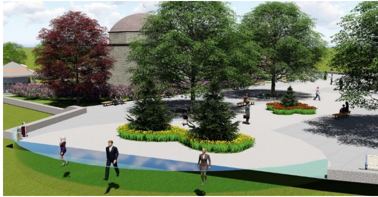
Şekil 13. Tophane Meydanı cam terastan görünüş