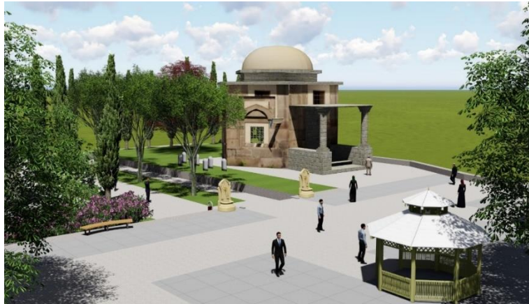
Şekil 8. Tophane Meydanı Osmangazi türbesi

Tophane Meydanı projesi yapılırken mevcut bitki varlığı ve alanın tarihi yapısı göz önünde bulundurularak tasarım yapılmıştır. Tarihi dokuya zarar vermeden iyileştirmeler yapılmış ve alanda görülen eksiklikler tamamlanmıştır. Öncelikle tarihi yapılara bakım ve onarım önerileri getirilmiştir. Türbe ziyaretine gelen misafirler kent içinden olabildiği gibi farklı şehir ve ülkelerden de olabilmektedir. İnsanların alanda daha fazla vakit geçirebilmeleri ve dinlenebilmeleri için türbe yakınında açık oturma alanları ve kameriyeler düşünülmüştür.