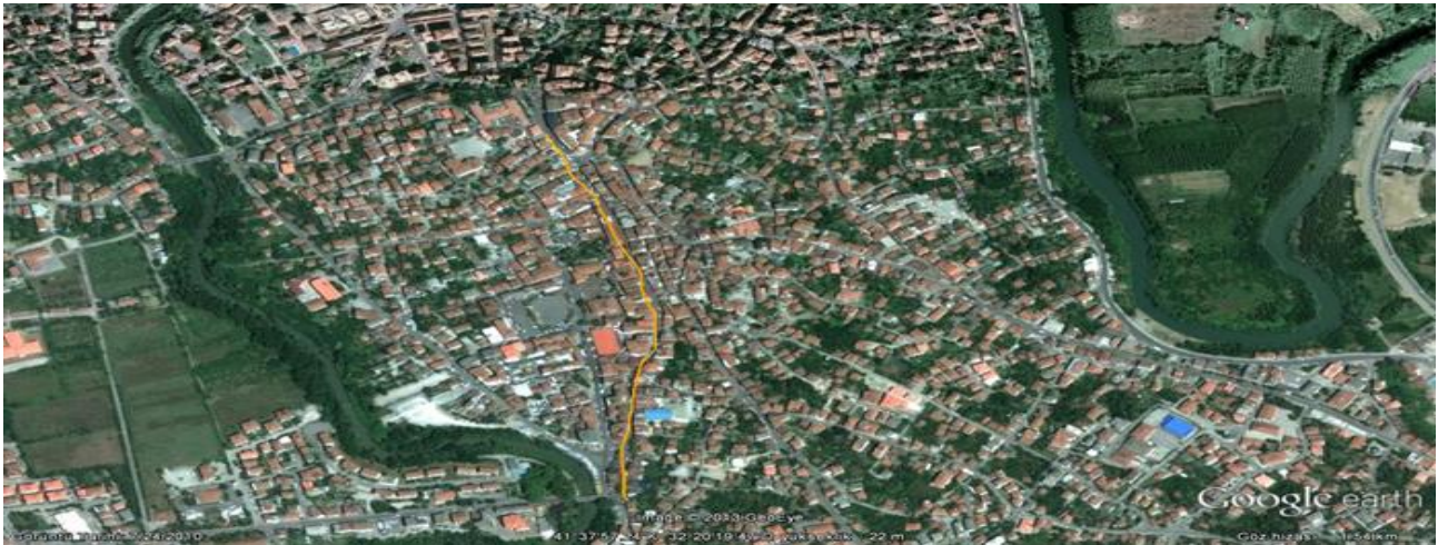
Fotoğraf 2- Zonguldak: Gözlemin Yapıldığı Caddeler (Bülent Ecevit, Gazi Paşa Caddesi ile Emral Çarşısı)