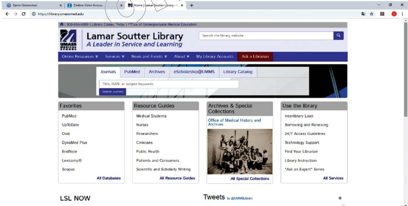
■ Şekil 2. Lamar Soutter Kütüphanesi arşiv ve özel koleksiyonu.

İstanbul Tıp Fakültesi Hulusi Behçet Kütüphanesi, ülkemizin en eski ve büyük tıp kütüphanelerindedir. 1470'te Fatih Sultan Mehmet tarafından açılan Fatih Darüşşifasında tıp eğitiminin ilk kez başlatılmış olması, İstanbul Tıp Fakültesinin doğuşu olarak kabul edilir. Kütüphanenin kökleri de bu tarihe kadar dayanır. Bu kütüphanenin web sayfasına yer alan bilgiler; kurum bilgileri, tarihçe, misyon ve vizyonu, bilgi hizmetleri, sanal kütüphane, duyurular ve iletişim bilgileridir. Ayrıca kütüphane sayfasından fakülte dergisine tam metin erişim vardır (İstanbul Üniversitesi İstanbul Tıp Fakültesi Kütüphanesi, 2019).