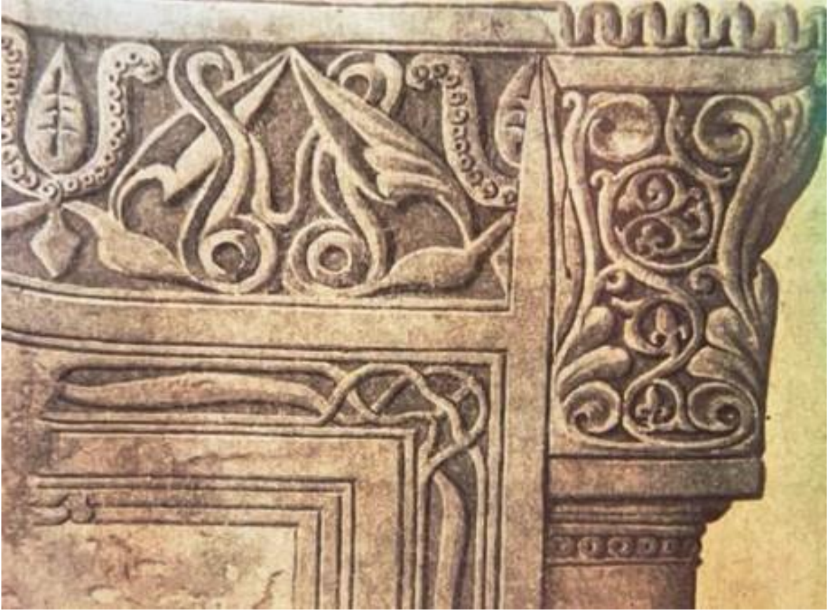
EK 7: Ebü'l Fazl Türbesi, giriş cephesi (Yüksel Sayan, Türkmenistan'daki Mimari Eserler (XI-XVI. Yüzyıl) , Kültür Bakanlığı Yayınları, Ankara 1999, s. 334.)