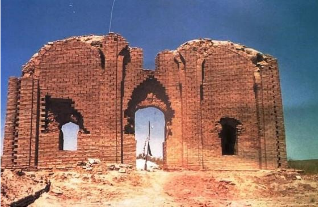
EK 4: Serahs Kalesi, kazılarla ortaya çıkarılan sur duvarlarından görünüş (Yüksel Sayan, Türkmenistan'daki Mimari Eserler (XI-XVI. Yüzyıl) , Kültür Bakanlığı Yayınları, Ankara 1999, s. 340.)