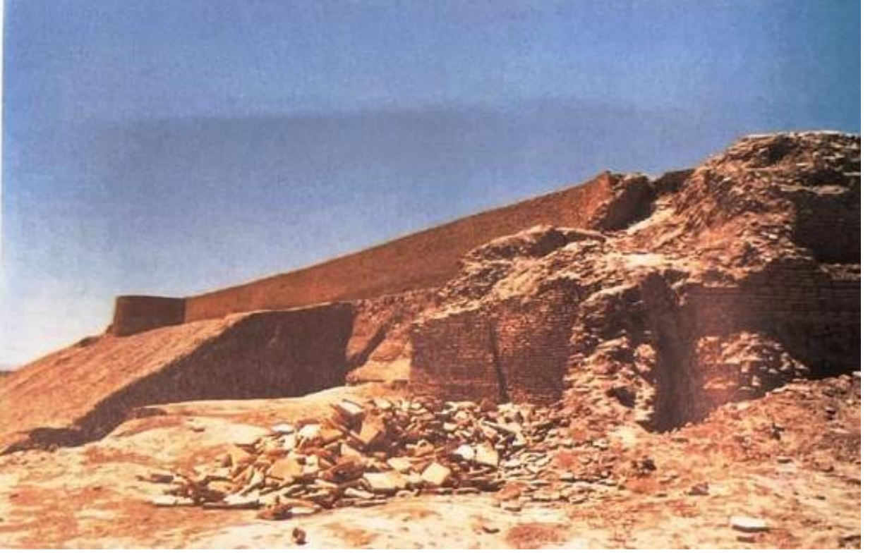
EK 5: Ebu Sait Türbesi (Yüksel Sayan, Türkmenistan'daki Mimari Eserler (XI-XVI. Yüzyıl) , Kültür Bakanlığı Yayınları, Ankara 1999, s. 341.)