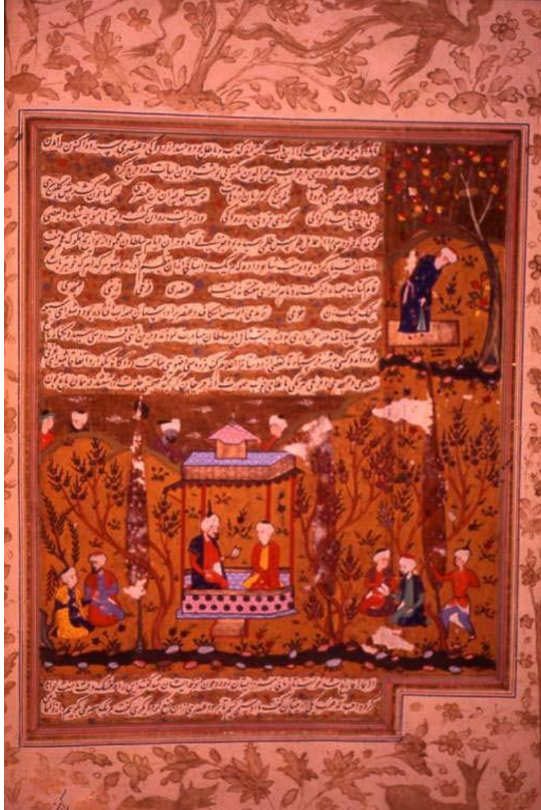
EK 3: Sultanın eğlence meclisi, Firdevsi ve müneccimler (Tanındı, 2008:288).