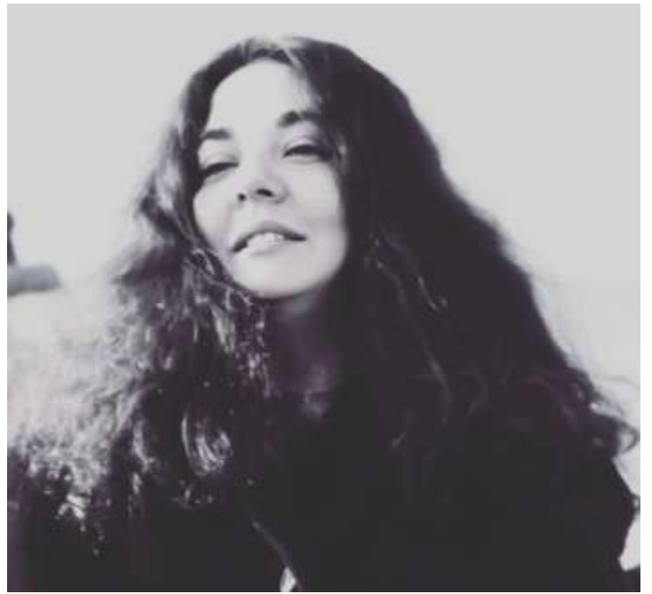
Ek-2: Göksel Koyuncu'nun fotoğrafları