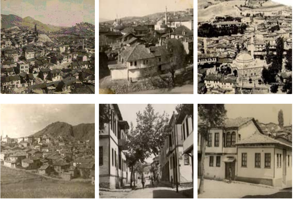
Şekil 3. Eskigediz'in 1970 yılı öncesine ait kentsel görünümü ve yapıları (Özav, 1995)

Tarihi kent dokusuyla dikkat çeken kent 2001 yılında tarihi kentler birliğine üye olmuştur. Eskigediz sıra dışı kimliği ile kentsel, doğal ve arkeolojik sit alanı kapsamına alınmıştır. Antik Kadoi Kenti kalıntılarının bulunduğu Asarardı Bölgesi, ikinci ve üçüncü derece arkeolojik alan olarak korunmaya alınmıştır. 111 adet yapı, kentsel sit ve mimarlık örneği olarak seçilmiştir. Bunun yanında 10 çeşme, 11 cami, 4 köprü, 3 çamaşırhane, 1 su yolu, 1 su kemeri, 1 su deposu ve askeri binalar da aynı kapsamda koruma altına alınmıştır [10].