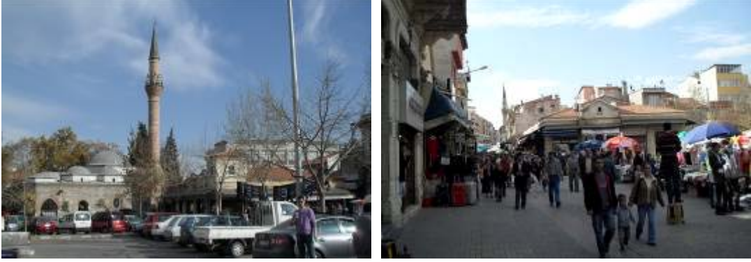
Şekil 4. Uşak Paşa Hanı çevresindeki cami, bedesten, arasta ve yaya mekanları

Karaali Cami ve Zincirli Cami) dini işlevlerinin yanında tarihi ve mimari açıdan da yerli ve yabancı ziyaretçilerin önemli uğrak merkezleridir. Uşak Paşa Hanı çevresinin meydan ve park olarak kullanılması bu tür ziyaretçilere de dinlenme alanı olarak yarar sağlayacaktır. Camilere ait yeşil doku ve park alanının ilişkilendirilmesi ile mekandaki açık yeşil alan sistemi kurgusu tamamlanacaktır.