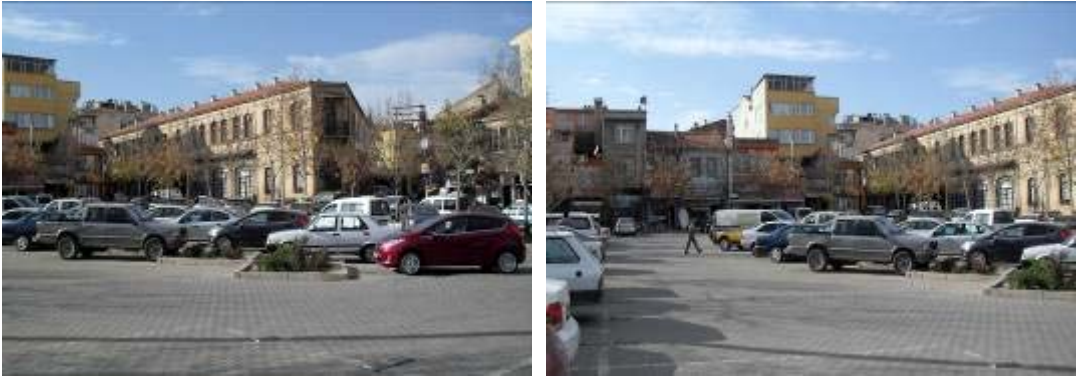
Şekil 7. Uşak Paşa Hanı çevresinde otopark olarak kullanılan öneri park alanı

Uşak Paşa Hanı çevresini okul, pazaryeri, meydan, cami, konut ve yaya kullanımına ait sokaklardan oluşan kamusal dış mekanlar oluşturmaktadır. Uşak Paşa Hanı'nın güncel işlevlerle yeniden değerlendirilmesi, sosyo-kültürel kullanım ağırlıklı yaya mekanlarının oluşturulması ile bölge farklı bir imaja sahip olacaktır.