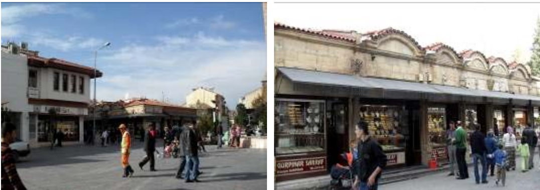
Şekil 5. Uşak Paşa Hanı çevresindeki meydan ve işyerleri

Uşak Paşa Hanı çevresinde bulunan tarihi bedesten ve arastalar hem ticari işlevleri hem de görsel ve tarihi değerleri ile önem taşımaktadır (Şekil 5-7). Bu alanlar geçmişten gelen önemlerini hiç kaybetmeden günümüze kadar taşımışlardır. Kentin ticaret merkezini oluşturan bu ticarethanelerde sarraf ve gümüşçüler yer almaktadır. Yaya sokaklarında geleneksel el sanatları, yöresel köy ürünleri, sebze, meyve ve giyecek gibi ürünlerin pazarlanması ile bölge her an canlı tutulmaktadır.