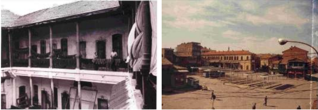
Şekil 2. Uşak Paşa Hanı'nın 1950'li ve 1980'li yıllara ait görünümü

Uşak Paşa Hanı genel görünüm bakımından yamuk bir plana sahiptir. Yapı avlulu ve iki katlıdır. Yapının iç bölümü ve odaları günümüzde otel olarak kullanılmaktadır. Uşak Paşa Hanı'nın dört tarafında küçük boyutta iş yerlerine ayrılmış mekanlar bulunmaktadır. Yapının dış mekana açılan bölümleri boş olarak durmakta ve herhangi bir işlev görmemektedir (Şekil 2).