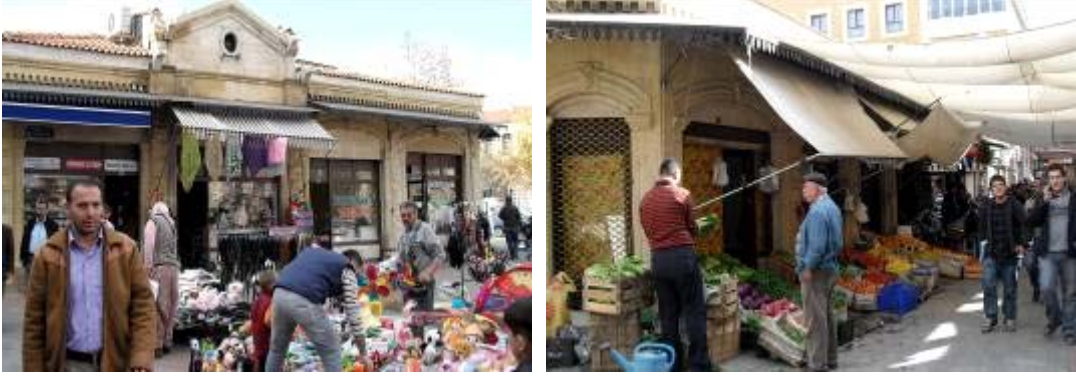
Şekil 6. Uşak Paşa Hanı çevresinde geleneksel el sanatları, yöresel köy ürünleri, giyecek ve yiyecek satışı yapılan yaya mekanları