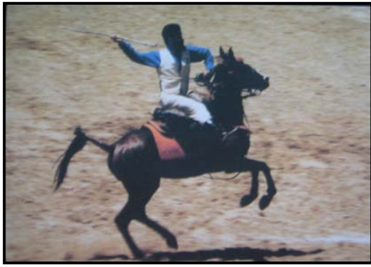
Şekil 2 Cirit Atma

Cirit Oyunu'nda iki takım bulunur. Bu takımlar karşılıklı olarak alanın en gerisinde aralarında 100 m bırakarak karşılıklı dizilirler. Ciritçiler bölgesel giyimleriyle atlarına binerler. Sağ ellerine atacakları ilk ciriti, diğer ellerine de yedek ve kamçı alırlar ( http://www.erkincan.gov.tr/cirit.htm , 2006).