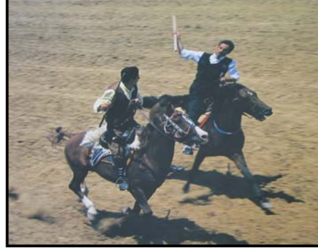
Şekil 5 Rakibi yakalayıp bağışlama (IRMAK ve Ark., 1999)

Ciritin ata isabet etmesi halinde ciriti atan oyuncu oyun dışı kalır bu yüzden atlılar kendilerine atılan ciritten kurtulmak için at üzerinde çeşitli taktikler (eğer boşaltma) uygularlar. Bütün oyuncuların ellerindeki ciriti atmalarından sonra en fazla puan alan galip takım ilan edilir. Günümüzde cirit modernize olmuş ve artık resmi bir spor dalı haline gelmiştir (YALMAN, 1977).