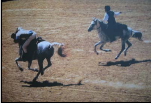
Şekil 4 Eger Boşaltma (IRMAK ve Ark., 1999)