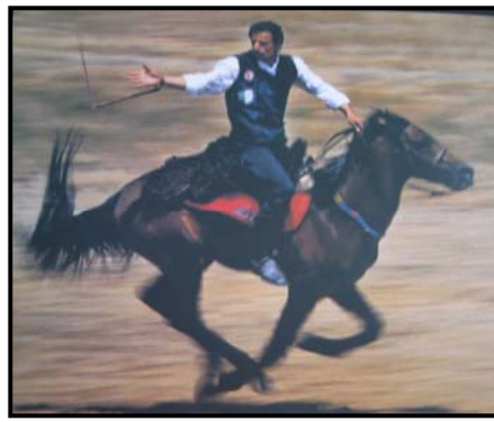
Şekil 3 Cirit Yakalama