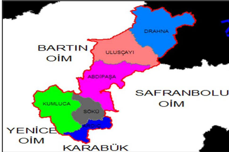
Şekil 3.2: Ulus Orman İşletme Müdürlüğündeki işletme şeflikleri.