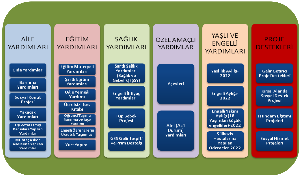
Şekil 3: Bartın Sosyal Yardımlaşma ve Dayanışma Vakfı'nın Yürüttüğü Yardım Faaliyetleri

Bartın Sosyal Yardımlaşma ve Dayanışma Vakfı bu engelleri aşmak için çeşitli alanlarda yardım faaliyetleri yürütmektedir. Vakfın yürüttüğü yardım faaliyetlerini aile yardımları, eğitim yardımları, sağlık yardımları, özel amaçlı yardımlar, yaşlı-engelli yardımları ve proje destekleri olmak üzere 6 ana başlık altında toplanmak mümkündür (BSYDV, 2015 Faaliyet Raporu).