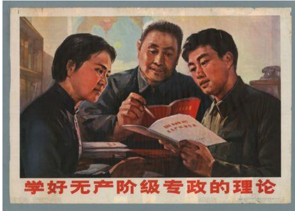
Şekil 5. Dördüncü Poster.

Dördüncü poster, 1975 yılında Qin Mingliang tarafından hazırlanmıştır. Duygusal işlev açısından ele alındığında posterde biri kadın üç kişinin yer aldığı görülmektedir. Posterdeki kişilerin önlerinde kitaplar bulunmakta ve erkeklerden biri kitabı işaret etmektedir. Posterin arka planında yer alan eşyalardan üç kişinin bulunduğu yerin kütüphane olduğuna yönelik algı oluşmaktadır. Posterde “Proletarya diktatörlüğü teorisini iyice inceleyin” yazısına yer verilmektedir.