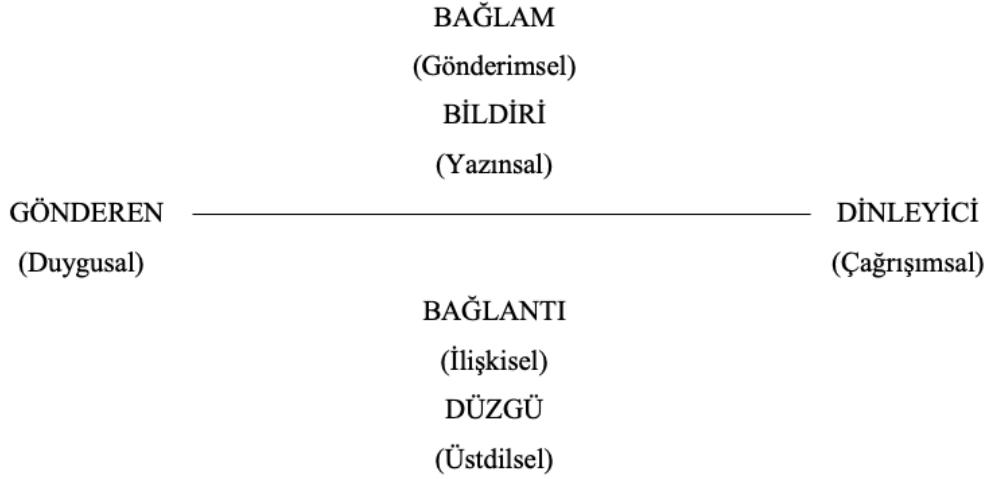
Şekil 1. Jakobson'un Modeli (1980, s. 81)

Jakobson'un iletişim modelinde altı sözlü iletişim etkeni (gönderen, bağlam, dinleyici, bildiri, bağlantı ve düzgü) bulunmaktadır. Konuşucu (verici/gönderen) olan dinleyiciye (alıcı/gönderilen) belirli bir koddan (kurallar bütününden) faydalanarak belirli bir bağlamda (dış gerçek/dil dışı bağlam) ve bağlantıyı sağlayan bir kanal (fiziksel destek) vasıtasıyla karşılıklı veya tek yönlü bir bildiri (ileti/mesaj) göndermektedir. Bu altı iletişim etkeni doğrultusunda ortaya çıkan altı temel işlevi (duygusal, gönderimsel, çağrışımsal, yazınsal, ilişkisel ve üstdilsel) bulunmaktadır.