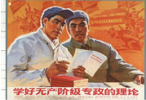
Şekil 6. Beşinci Poster (Kaynak: IISH, 2021e).

Beşinci poster, 1975 yılında Qiu Ruimin tarafından hazırlanmıştır. Duygusal işlev boyutunda incelendiğinde posterde işçi tulumları içerisinde iki kişinin bir masanın önünde bir kitaba baktığı yansıtılmaktadır. Masanın üzerinde başka kitaplar da yer almaktadır. Posterin arka planında ise bayraklar etrafında silahlı insanların bir yöne doğru ilerledikleri algısı oluşturulmaktadır. Posterde “Proletarya diktatörlüğü teorisini iyi inceleyin” yazısı bulunmaktadır.