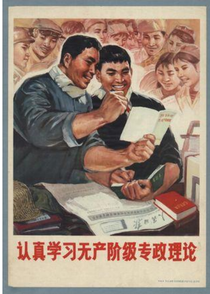
Şekil 7. Altıncı Poster.

Altıncı poster, Li Naizhou tarafından 1976 yılında hazırlanmıştır. Duygusal işlev açısından ele alındığında posterde iki erkeğin bir masanın önünde olduğu yansıtılmaktadır. Masanın etrafındaki her iki erkeğin de elinde kitap bulunmakta, erkeklerden biri elindeki kitapta bir yeri işaret etmektedir. Masanın üstünde de başka bir kitap bulunmaktadır. Posterin arka planında da tebessüm eden ve iki erkeğin elindeki kitaba bakan başka insanlara yer verilmektedir. Posterde “Proletarya diktatörlüğü teorisini ciddiyetle inceleyin” yazısı bulunmaktadır.