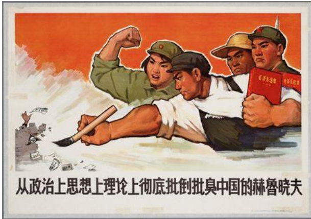
Şekil 2. Birinci Poster.

Birinci poster, 1967 yılında hazırlanmış fakat kim tarafından hazırlandığına yönelik bilgiye yer verilmemiştir. Duygusal işlev boyutunda incelendiğinde posterde biri kadın dört kişiye yer verilmektedir. Posterde yer alan kadın ve bir erkeğin üzerinde ÇHC'nin silahlı kuvvetleri olan Çin Halk Kurtuluş Ordusu'na ait üniforma bulunmakta, diğer erkeklerden birinin üzerinde işçi tulumu diğerinin başında ise hasır şapkanın olduğu görülmektedir. Posterin solunda ise yıkık, küçük bir kale burcunun üstünden bir elin sarkmakta ve etrafa kâğıtlar dağılmaktadır. Posterdeki dört kişi, burçtaki kişiyi hedef almaktadır. Asker üniforması içerisindeki kişinin yanında kırmızı bir kitap, işçi tulumu içerisindeki kişinin de bir elinde kırmızı kitap, diğer elinde ise fırça bulunmaktadır. Asker üniforması içerisindeki kadın ise sağ elini yumruk yaparak havaya kaldırmaktadır. Posterde "Çinli, Kruşçev'i siyasi, ideolojik ve teorik açıdan tamamen eleştir" yazısı bulunmaktadır.