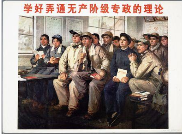
Şekil 4. Üçüncü Poster.

Üçüncü poster, 1975 yılında Lu Juding tarafından hazırlanmıştır. Duygusal işlev boyutunda incelendiğinde posterde işçi tulumları içerisinde bir grup insanın bir odada ya da bir salonda olduğu yansıtılmaktadır. Posterde yer alan kişilerin etrafında kitaplar bulunmakta, bazıları da ellerinde kitaplar tutmaktadır. Posterdeki kişilerin çoğu benzer yöne bakmakta ve bir şeyi izlediklerine yönelik algı oluşturulmaktadır. Posterde “Proletarya diktatörlüğü teorisine hâkim olmayı öğrenin” yazısına yer verilmektedir.