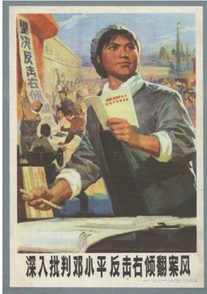
Şekil 9. Sekizinci Poster.

Sekizinci Poster, 1976 yılında Wu Qizhong tarafından hazırlanmıştır. Duygusal işlev açısından ele alındığında posterde işçi tulumu içerisinde bir kadının bir masanın önünde olduğu aktarılmaktadır. Posterdeki kadının bir elinde bir kitap diğer elinde de bir kalem bulunmaktadır. Kadının önündeki masanın üstünde beyaz bir kâğıt yer almakta ve kadının kâğıda bir şeyler yazacağına yönelik algı oluşmaktadır. Posterin arka planında ise insanların duvarlara yazılar astıkları aktarılmaktadır. Posterde “Deng Xiaoping'e yönelik eleştiriyi derinleştirin, kararları tersine çeviren sağa sapma rüzgârına karşı saldırın” yazısı bulunmaktadır.