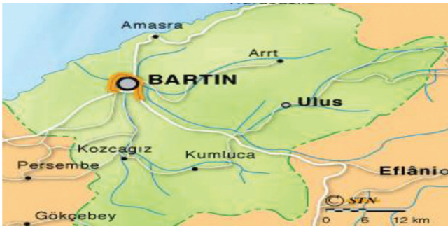
Bartın’ın Coğrafi Konumu. Kaynak http://www.turkiye-rehberi.net/bartın-haritasi.asp (16.03.2016 tarihinde erişildi.)