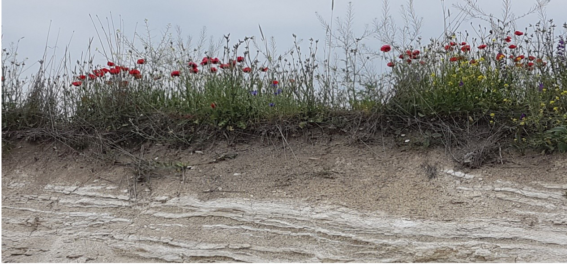
Şekil 2. Çalışma alanına ait yamaç toprak profili Figure 2. Slope soil profile of study area

mında en çok payı buğday ve arpa gibi ürünlerin yetiştirildiği “tarla” alanları almaktadır. Çalışma alanının genel durumunu yansıtan toprak profili Şekil 2’de verilmiştir