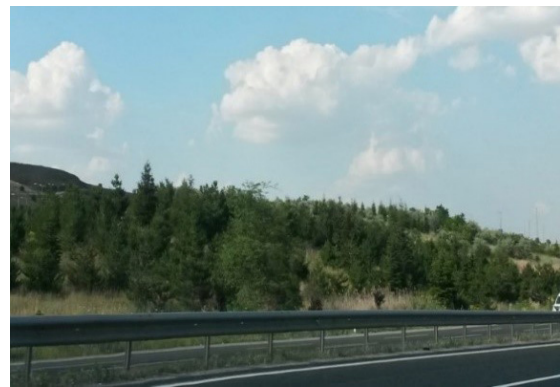
Şekil 7. Ankara-Eskişehir karayolu ağaçlandırma çalışması Figure 7. Ankara-Eskişehir highway afforestations