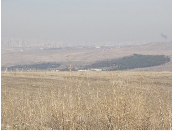
Şekil 8. Zırlıklı birlikler içerisinde kalan ağaç grupları Figure 8. Tree groups in the military field

Cushman ve arkadaşları (2009), yaptıkları bir çalışmada arazi kullanımından kaynaklı habitat kaybının ve yollardan kaynaklı habitat bölünmesinin kısmi öneminin, söz konusu arazideki; habitat gereksinimlerinin, organizmaların yayılış kabiliyetlerinin, yolların biçimi ve arazi kullanımları arasındaki etkileşimlere bağlı olduğunu ifade etmektedirler. Çalışma alanında yapılan yol çalışmaları yukarıda ifade edilen hususu teyit eder durumdadır.