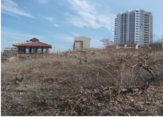
Şekil 10. Çalışma alanında yer alan bağ kalıntılarının bir görünümü Figure 10. A view from the ruins of the vineyard

200.000 olması öngörülmektedir (ABB-1). Bu öngörüler kapsamında Bağlıca ve Yapracık'ın kentleşme veya banliyöleşme sürecinde ne kadar baskı altında kalacağı apaçık görülmektedir.