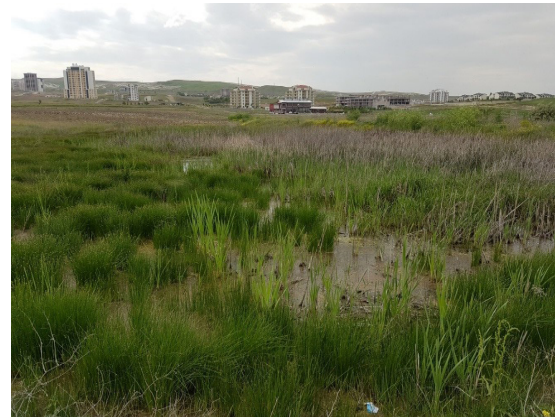
Şekil 4. Çalışma alanında juncus türlerinin yer aldığı bir alan Figure 4. Some juncus species in study area