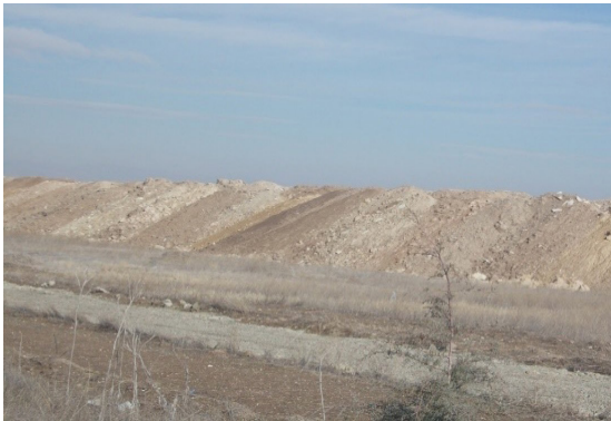
Şekil 9. Yol yapımı amacıyla yığılmış topraklar Figure 9. Superimposed soils for road building

Bağlıca ve Yapracık yerleşim alanları kentleşme ve banliyöleşmenin çok büyük etkisi altındadır. Günden güne konut ve ticaret merkezleri yapımı hızla devam etmektedir. Önceleri köylüler tarafından buğday, arpa gibi tarım ürünleri yetiştirmek için kullanılan bu alanlar üzerinde şimdi yüksek katlı yerleşim alanları ile geniş alanlara yayılmış ticaret merkezleri inşa edilmektedir. Öyle ki geçmişte köylüler tarafından da ifade edildiği üzere geniş bağ alanlarının bulunması suretiyle adını buradan alan “Bağlıca” (Şekil 10) günümüzde tam bir metropolitan olma yolunda hızla ilerlemektedir.