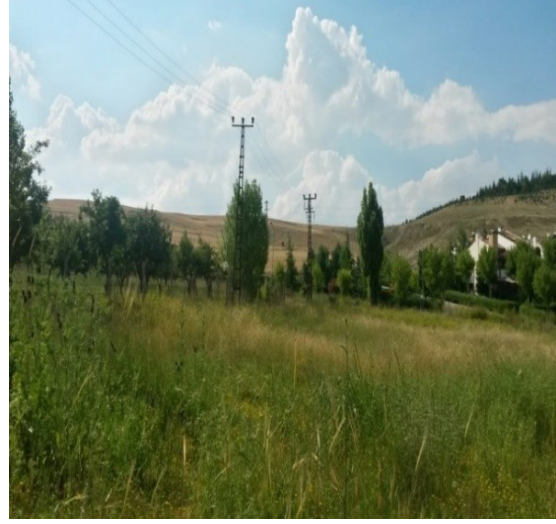
Şekil 6. Bahçe olarak ayrılmış bir alan Figure 6. A reserved field as a garden

Her ne kadar toplu konut, ticaret merkezleri ve yol yapımı gibi unsurların inşası ile mevcut alanlarda yer alan bitki örtüsünün azaltılması ile biyolojik çeşitlilik azalsa bile yukarıda belirtilen uygulamalar ile yerel türlerin dışında farklı türlerin de kullanılması suretiyle biyolojik çeşitliliğin arttığı da tespit edilmiştir. Çalışma alanında yer alan ağaç formundaki bitkilerin çap ve kapalılık durumuna göre yapılan gruplandırma Tablo 1’de verilmiştir.