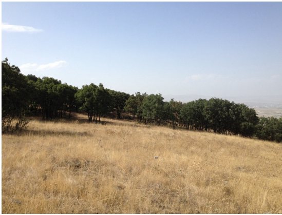
Şekil 3. Yapracık Meşe dağında yer alan meşe ormanı kalıntısı Figure 3. The remains of oak forest in Meşe Mountain at Yapracık

Çalışma alanında yer alan meşe ormanı kalıntılarına ve juncus türlerinin yer aldığı alana ait resimler Şekil 3 ve Şekil 4’te verilmektedir.