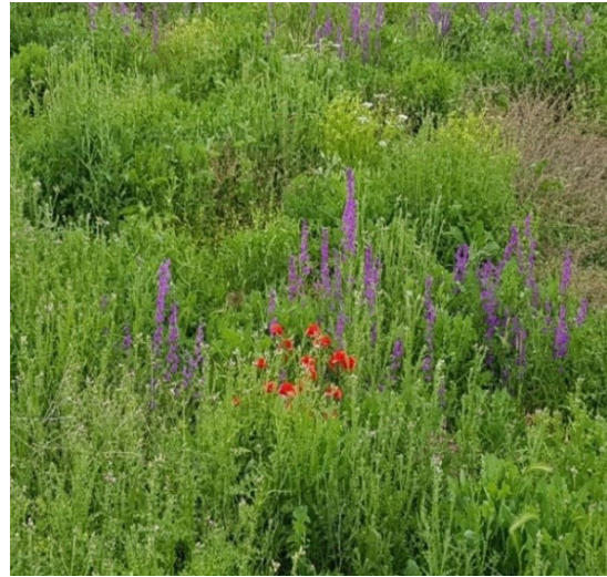
Şekil 5. Çalışma alanında yer alan bazı bitki türleri Figure 5. Examples some plant species at study area