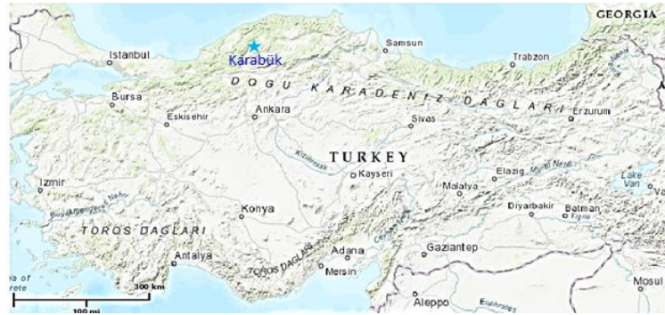
Şekil 1. Çalışma alanını gösterir harita (OGM, 2019).