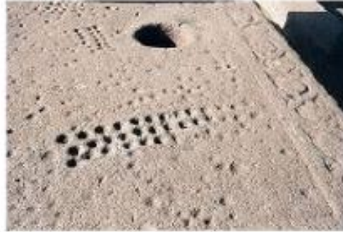
Resim 3. Kazakistan’da bulunan mangala kayası (M.Ö. 3000-1200) Resim 4. Habeşistan’da bulunan mangala kayası