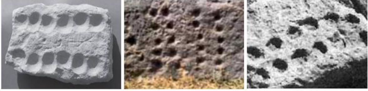
Resim 11.12.13. Mersin, Kanlı Divane'de bulunan 1000 yıllık mangala kayası.

Mangalanın yeniden tanıtılması ve yaşatılması amacıyla Ekim 2009'da mangala tahtası üretimine başlanmış, okullar bünyesinde kurslar ve yarışmalar düzenlenmiş, kulüpler kurulmuş, Kültür ve Turizm Bakanlığı mangala oyununun yeni nesillere aktarılması ve tanıtılmasının yararlı olacağını ülkemizin tanıtımına destek olacağını tavsiye eden bir karar çıkarmıştır. Yaygınlaştırma çalışmaları kapsamında seminer ve paneller düzenlenmiş, öğretmen adaylarına mangala öğretiyorum projesi gerçekleştirilmiş, ulusal fuarlarda tanıtımları yapılmış, Türkiye gençler mangala şampiyonası yapılmıştır. Özellikle kültürel mirası koruma çalışmalarında halkında önemli bir paydaş olduğu göz önünde bulundurulmalıdır (Akkuş ve ark.,2016). Bu doğrultuda Türkiye'de şuan yaklaşık elli bin kişinin bu oyunu oynadığı bilinmektedir. Türkiye'de 2015 yılında kurulan mangala federasyonu ve Türk zeka oyunları (TAZOF) federasyonu bünyesinde de tanıtım ve yaygınlaştırma faaliyetleri sürdürülmektedir (www.haber7.com).