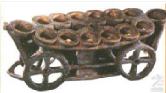
Resim 1. Taş üzerine kazınmış dokuz kumalak Resim 2. Mankala oyun tahtası (M.S. 20. yy)

Günümüzde pek çok Türk halkında oynanmakta olan bu oyun bozkır kültürünü devam ettirmekte olan Kazak, Kırgız, Türkmen ve Altay gibi Türk halkları arasında varlığını sürdürmektedir. Tarihte oyunun hayvan güderken çobanlar tarafından kayalara karşılıklı çukurlar oyularak ve bu çukurlara belli sıradaki taşları sırasıyla bırakarak oynandığı söylenir (Küçük yıldız, 2015). Oyuna adını verilen kumalağın ise Kazak Türkçesi'nde kelime anlamı koyun veya keçinin yuvarlak ve siyah dışkıını ifade etmekte olduğundan, savaşçı bir yapıya sahip olan Türk çobanlarının bu oyunu oynayarak savaş stratejileri tasarlayarak zaman geçirdiklerinden ayrıca Türklerin sadece avlanarak silah kullanma becerilerini değil aynı zamanda bu tür oyunlarla savaş stratejilerini geliştirerek bu sayede yenilmez oldukları söylenmektedir ( www.abdulvahapkara.com ). Yabancı seyyahların seyahatnamelerinde anlattıkları bu oyun Türklerin saatlerce hiç tartışmadan zevkle oynadıkları bir oyun olarak anlatılmıştır. Oyunu inceleyen uzmanlar Türklere ait stratejiler barındırdığından da bahsetmektedirler. Araştırmalara göre taşlar asker olarak görülmektedir en çok askeri toplayan oyunu kazanmakta ve bu da oyunun savaş oyunu olarak oynandığını desteklemektedir. Kazak Türkçesi'nde her bir çukur otağ ve alınan taşların