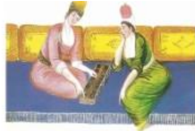
Resim 7.8. 1737 İstanbul, Jean Baptiste Van Mour, Topkapı Sarayı'nda mangala oynayan kadınlar.