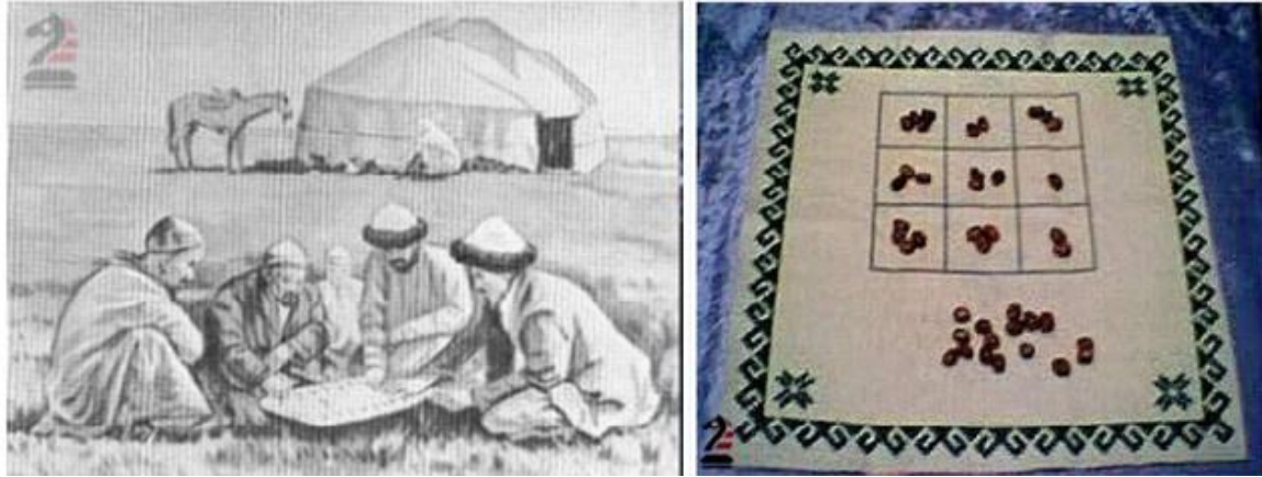
Resim 5. Eski Türkler "dokuz kumalak" oynarken Resim 6. "Dokuz kumalağın" farklı bir biçimi