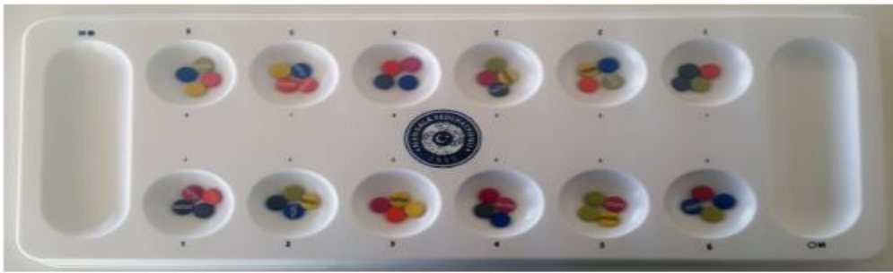
Resim 14. Mangala

Hamleyi yapan oyuncu elindeki son taşı hazinesine bırakabilirse tekrar oynama hakkı olur. Hamle yapan oyuncu elindeki son taşı kendi boş kuyusuna bırakır ve bu kuyunun karşısındaki rakip kuyuda taş var ise hem rakip kuyudaki hem kendi kuyusundaki taşı alarak hazinesine taşır,hamle sırası rakip oyuncuya geçer. Kuyusundaki taşları ilk biten oyuncu rakibin kuyusundaki taşları hazinesine taşır(www.mangaia.com).