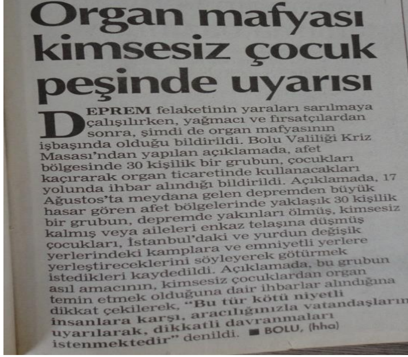
Şekil 1.1: Organ mafyası kimsesiz çocuk peşinde uyarısı (Hürriyet, 1999)

Organ mafyası, sağlıklı organ arayan ve bu organ uğruna belirlenmiş miktarda para vermeyi kabul eden bireyler ile organını satmak isteyen bireyler arasında iletişimi sağlayan yasadışı araçlardır (middleman). Birçok dünya ülkesinde illegal olsa da biyokapitalizm yükselmesi ile bir sektör haline gelmiştir. Bu durumun temel sebebi, sağlıklı organ için yaşanan talebin karşılanamamasıdır. Yasal yollarla elde edilemeyen organların kaçakçılığı gizli biçimde yürütülmektedir ve nakiller, yüksek ücretler karşılığı gerçekleştirilmektedir. Bu durum da bize, organ ticaretinden elde edilen yüksek kazançların çekiciliğini gösterir. Aracılar hem nakli gerçekleştiren doktorlardan hem de organını satan donörden daha fazla meblağ kazanmaktadır (Tükel, 1989a). “Kolay” para kazanmak isteyenleri cezbetmektedir. Dünyada ticareti en fazla yapılan organ böbrektir (Scheper-Hughes, 2005). Bunun sebebi, organ ticaretinin çoğunlukla canlı vericiler üzerinden yapılması ve insanlarda iki adet böbrek bulunduğundan, bir böbreği satsa da “yedek” böbrek ile hayatını devam ettirebilecek olmasıdır. Araştırmalar organ ticaretinin donörün hayatını riske attığını ve dezavantajlı gruplara mensup bireylerin biyokapitalizmin sömürüsüne açık hale gelmesi nedeniyle kınandığını göstermektedir. Bununla birlikte biyokapitalizm, hastaya donörün yaşını, cinsiyetini seçme hakkı vermektedir (Aronsohn vd., 2010).