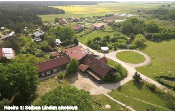
Resim 1: Sieben Linden Ekoköyü