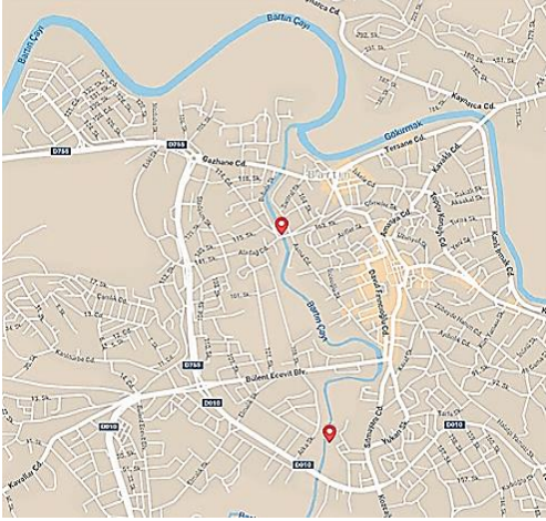
Şekil 1. Örneklem noktalarının lokasyonları

Örnekleme noktaları, atıksu deşarj noktalarından sonra tam karışımın gerçekleştiği yerler tahmin edilerek seçilmiş ve lokasyonları Şekil 1’de gösterilmiştir. Numune almadan önce bütün kaplar laboratuvarında deterjan ile yıkanmış, durulanmış ve distile su ile 3-4 kez çalkalanarak hazırlanmıştır. Su örnekleri plastik kap ile yüzeyden yaklaşık olarak 40 cm derinden alınmıştır [15]. Fizikokimyasal parametreler analiz edileceği için numune şişeleri numune ile ağzına kadar üstte hava boşluğu kalmayacak şekilde doldurulmuş ağzı sıkıca kapatılarak laboratuvarında 4°C’de muhafaza edilmiştir [16]. pH, çözülmüş oksijen, elektriksel iletkenlik, sıcaklık, toplam çözülmüş katılar arazide ölçülmüştür. Nitrat analizleri aynı gün yapılmış ve diğer analizler için numuneler pH=1-2 olacak şekilde ayarlanıp 4°C’de muhafaza edilmiştir.