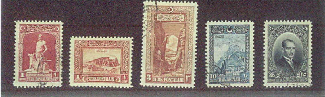
Ek-4. Yeni Cumhuriyet Pullarından Örnekler.