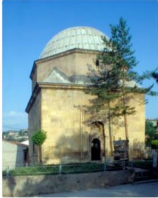
İsmâil Bey Türbesi – Kastamonu