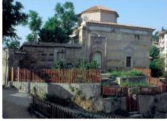
İsmâil Bey Külliyesi'nin sıbyan mektebi