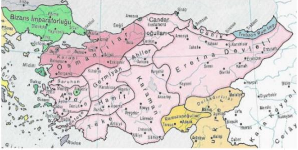
Ek 1: Beylik Haritası

Candaroğulları Beyliği Haritası; https://bberksan.blogspot.com/p/anadolu-beylikleri.html