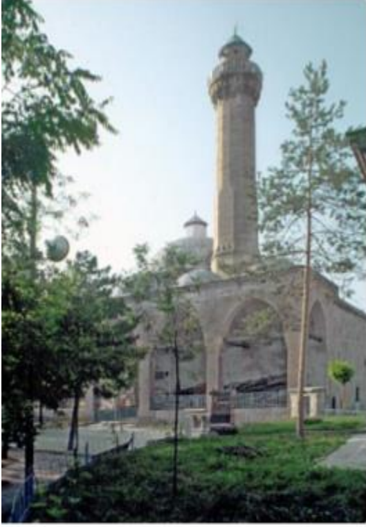
İsmâil Bey Camii – Kastamonu