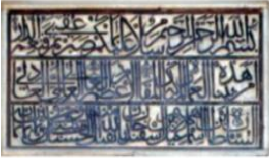
İsmâil Bey Camii'nin kitâbesi

https://islamansiklopedisi.org.tr/ismail-bey-kulliyesi , 23.10.2023.