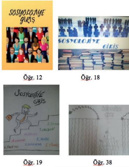
Resim 2. Kitap kapağı tasarımlarında metafor gerekçelerinin kullanımı ile ilgili öğrenci çalışmalarından örnekler

Tablo 3 ile ilişkili olarak değinilmesi gereken bir başka ayrıntı, metaforlarını kullanmadıkları halde metafor gerekçelerine uygun tasarımlar yapan öğrencilerin varlığıdır.