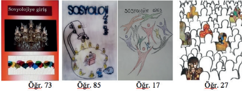
Resim 1. Kitap kapağı tasarımlarında metafor kullanımı ile ilgili öğrenci çalışmalarından örnekler

Tablo 3'e göre, öğrencilerin % 77.65'i sözel olarak ifade ettikleri metaforları kullanırken % 22.35'i ifade ettikleri metaforların dışına çıkmışlardır. Bununla ilgili resim 1 ve 2'de bazı örnekler verilmiş ve değerlendirilmiştir.