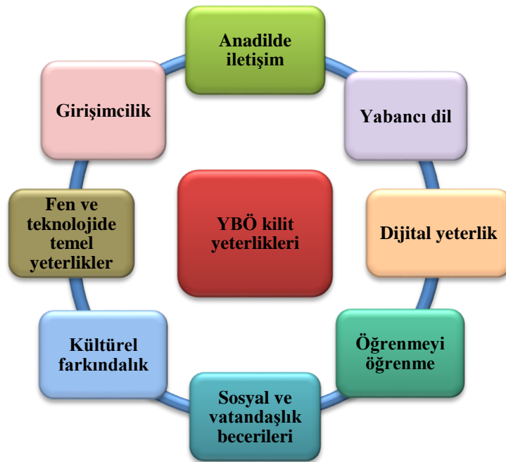
Şekil 1.1: Avrupa Birliği YBÖ kilit yeterlikleri (Avrupa Komisyonu, 2007).

Avrupa Birliği tarafından YBÖ yeterliliği kavramı; bireyin bilgi, beceri ve tutumlarıyla ilgili daha kapsamlı bir kavram olarak ifade edilmektedir. Temel Yeterlik Alanları Avrupa Çerçevesi, YBÖ için bilgi toplumu içinde kişisel başarı, aktif vatandaşlık, sosyal uyum ve istihdam edilebilirlik için gerekli olan hayat boyu öğrenmenin temel kilit kriterlerini belirlemiştir. Bu yeterlikler Şekil 1.1’ de gösterilmiştir (Avrupa Komisyonu, 2007):