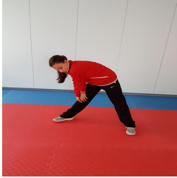
Şekil 15: Germe Egzersizleri 6

6. Bacaklar iki omuz genişliğinde açılarak vücudu belden bacak yönünde eğerek iki el ile diz kapağı tutularak germe yapılır. Aynı şekilde diğer bir tarafa da uygulanır (Şekil 15).