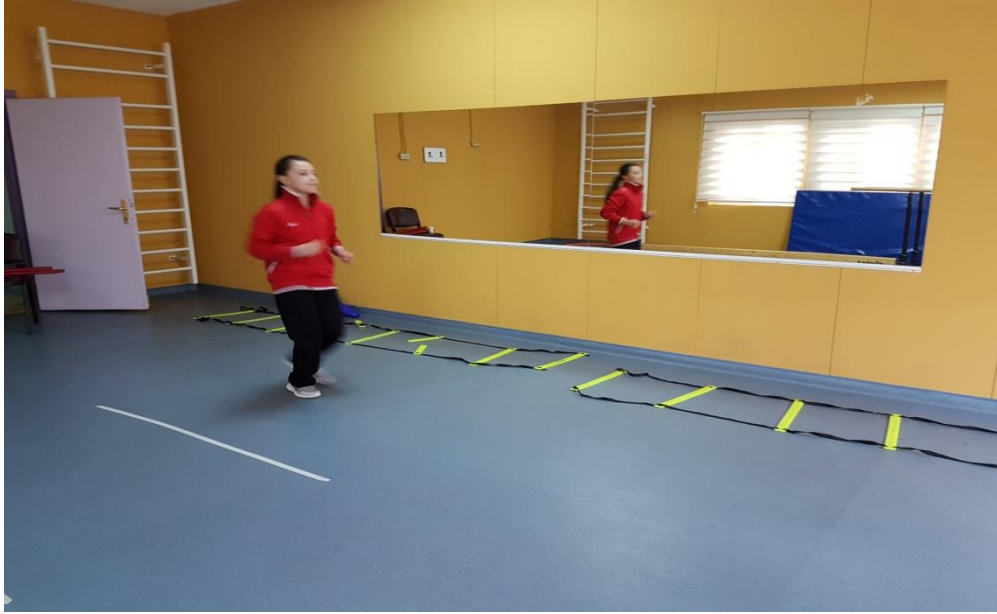
Şekil 1. Salon içinde düşük tempoda yürüme ve germe egzersizleri

Öncelikle çocukları egzersize odaklandırmak için isimleriyle hitap ederek ‘çalışmaya başlıyoruz, herkes hazır mı?’ biçiminde soru sorulmuştur. Çocuklardan hazır olduklarına dair herhangi bir jest, mimik ya da sözcük alındığında çocuklara ‘aferin’ şeklinde pekiştirme sunulmuş ve çalışmaya başlanmıştır.