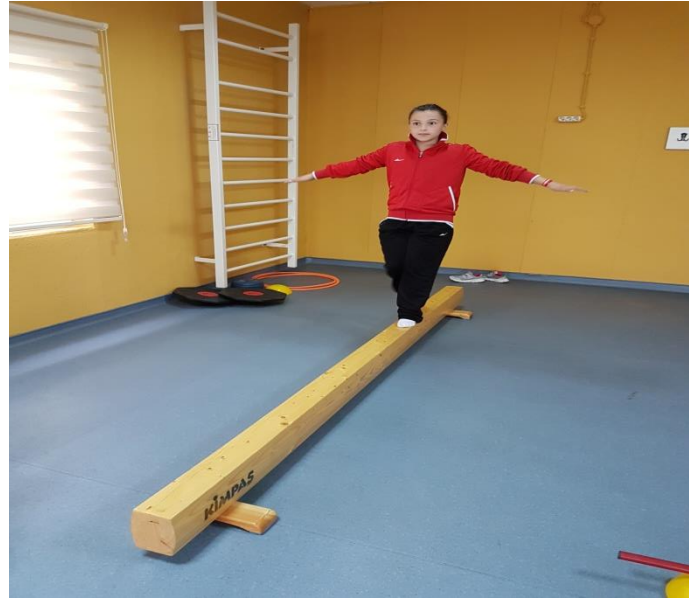
Şekil 2. Denge aleti ve denge takozları üzerinde yürüme egzersizleri