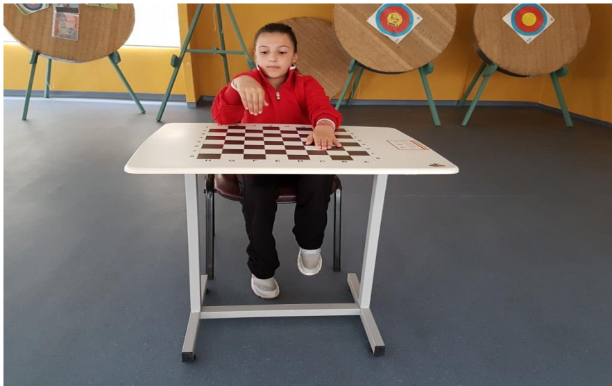
Şekil 8. Farklı yönde eş zamanlı ayak ve el parmakları vurma

Çocuk, Şekil 8’de olduğu gibi sol el parmağını ve sağ ayağını aynı anda daha sonra, ters yöndeki el parmağını ve ayağını aynı anda vurur. Çocuk bu çalışmayı 10 adet ardı ardına ayak-parmak vuruşu olarak tekrarlar. Hata yapması durumunda ikinci hak verilir. İkinci hakkında tam puan alabilmesi için 10 adet doğru yapması gerekir. Yapamaması durumunda doğru sayısı kadar değerlendirme ölçeğine göre nokta puanlama olan 0-4 arası puan verilir.