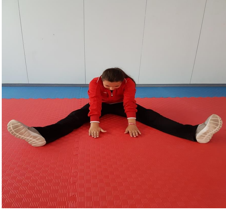
Őekil 17: Germe Egzersizleri 8

8. Oturur pozisyonda bacaklar aılarak vucut ne doėru eėilerek avu ileri yere deėecek Őekilde germe hareketi yapılır (Őekil 17).