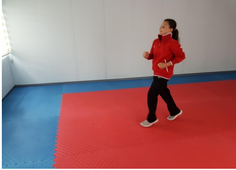
Şekil 4. Koşma hızı ve çeviklik