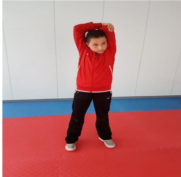
Şekil 12: Germe Egzersizleri 3

3. Ayakta dik duruş pozisyonunda kollar baş üzerinde dirseklerden biri bükülerek, ters kol dirsekten tutulur gerdirme yapılır. Aynı şekilde diğer kol da gerdirilir (Şekil 12).