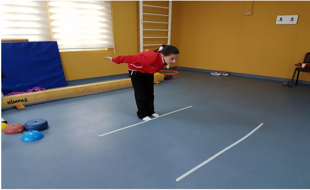
Şekil 9. Kuvvet

Bu çalışma iki adet denemeden oluşup, puanlama santimetre üzerinden kaydedilir ve değerlendirme ölçeğinde nokta puanlamaya göre 0-12 arası puan verilir (Bruininks, 2005).