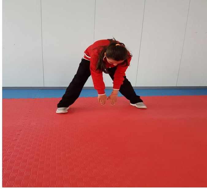
Şekil 13: Germe Egzersizleri 4

4. Bacaklar iki omuz genişliğinde açılıp, dizler bükülmeden öne doğru eğilerek avuç içleri yere değdirilir (Şekil 13).