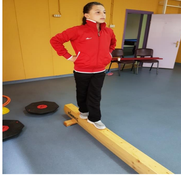
Şekil 6. Denge aleti üzerinde ayak başparmak topuk temasında durma

Çocuk, elleri belinde denge aleti üzerinde arkadaki ayakucu, öndeki ayağının topuğuna temas edecek biçimde 10 saniye beklemeye çalışır (Şekil 6). Bu çalışma 10'ar saniyelik iki denemeden oluşup, değerlendirme ölçeğindeki nokta puanlamaya göre 0-4 arası puan verildi.