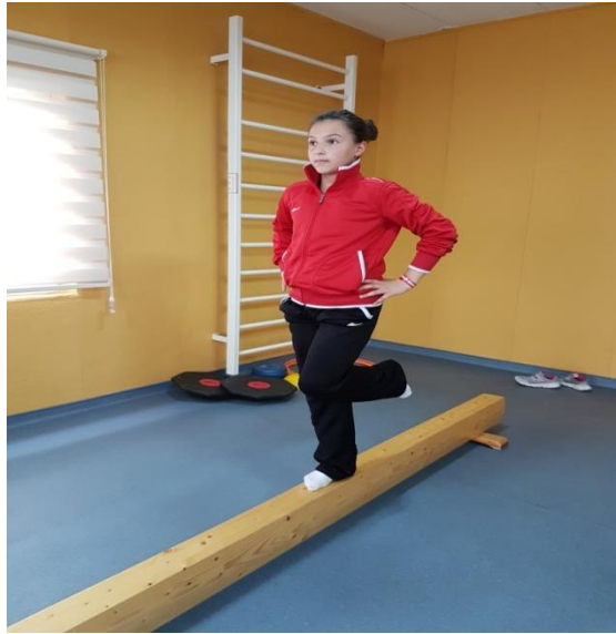
Şekil 5. Denge tahtası üzerinde tercih edilen ayak üzerinde durma

Çocuk denge tahtası üzerinde, tercih ettiği ayağı yerde, diğer ayağı yere paralel olacak şekilde bükülü vaziyette, elleri belinde, göz hizasındaki noktaya bakarak 10 saniye dengede kalmaya çalışır (Şekil 5). Bu çalışma 10'ar saniyelik iki denemeden oluşup, değerlendirme ölçeğindeki nokta puanlamaya göre 0-4 arası puan verildi.