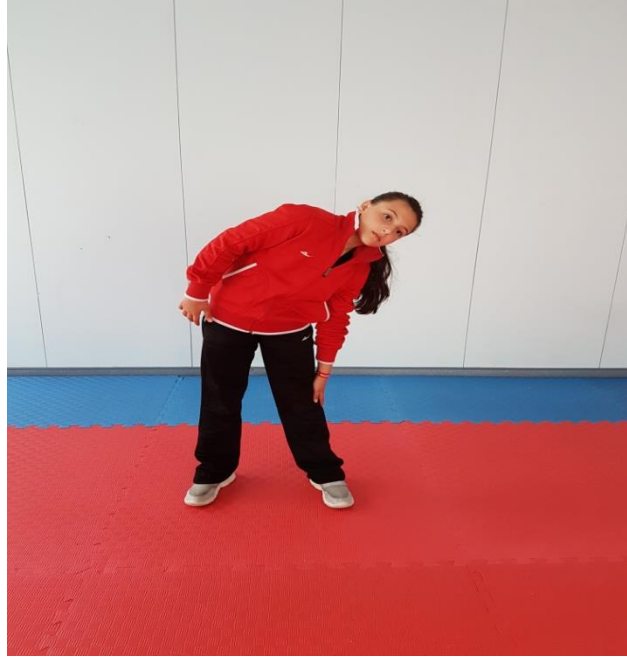
Şekil 14: Germe Egzersizleri 5

5. Ayakta dik duruş pozisyonunda ayakları omuz genişliğinde açarak, öne doğru eğilmeden vücudu belden yana doğru bükerek el en uzak yere değdirmeye çalışılır (Şekil 14).