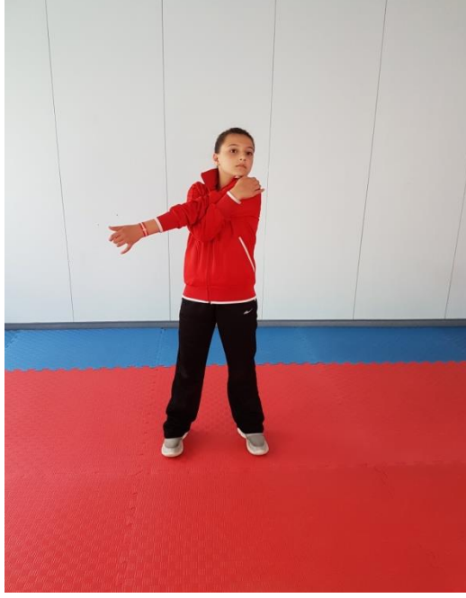
Şekil 11: Germe Egzersizleri 2

2. Ayakta dik duruş pozisyonunda, ayaklar omuz genişliğinde açık bir şekilde, sağ kol sol kolun altından sol omuz başını tutarak gerdirme yapılır. Aynı şekilde diğer kol da gerdirilir (Şekil 11) .