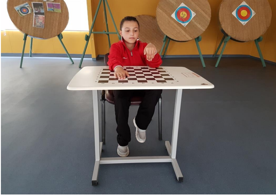
Şekil 7. Aynı yönde eş zamanlı ayak ve el parmakları vurma