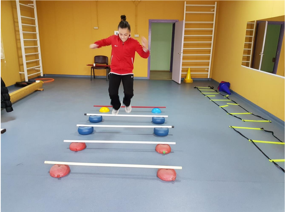
Şekil 3. Çift ayakla sıçrayarak engeller üzerinden geçme ve step sehpalarının üzerine çıkma ve inme egzersizleri