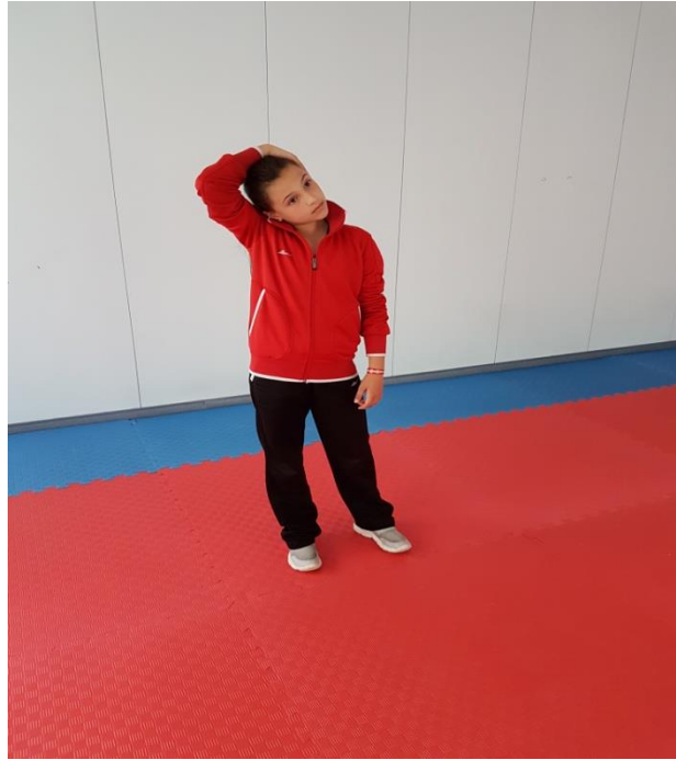
Şekil 10: Germe Egzersizleri 1

1. Aşırı zorlamadan, ayaklar omuz genişliğinde açık sol el ile başın üzerinden zıt yönde kulak hizasından tutularak gerdirmenin aynı şekilde diğer elle de hareketin yapılması (Şekil 10).